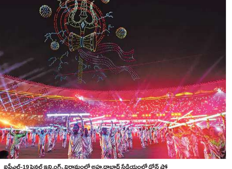
జూన్ 19 ఫైనల్ ఇన్నింగ్స్ విరామంలో అప్పారాబాద్ స్టేడియంలో డ్రోన్ షో