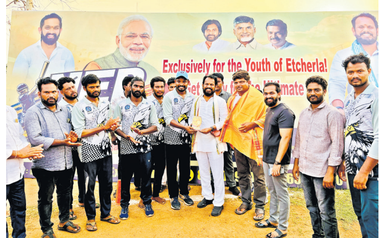
ను ఉత్సాహ పరచడానికి విచ్చేసిన స్థానిక కుటుంబ సభ్యులను సన్మానించారు.