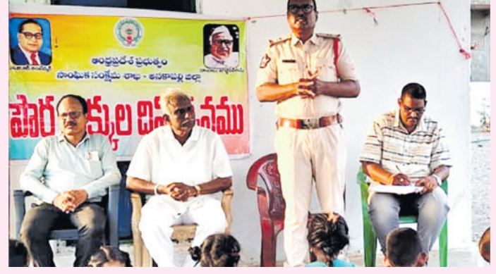
అనకాపల్లి రూరల్, మే 31 (మనసులో మాట):