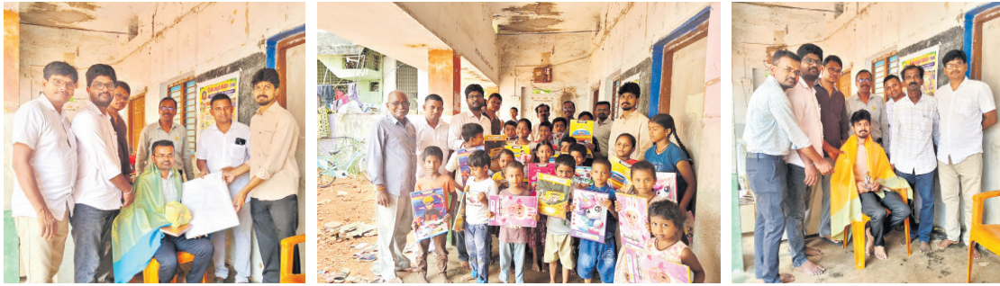
మునగపాక, మే 31, మనసులో మాట