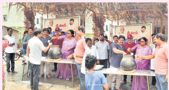
ఎలమంచిలి టౌన్, మే31, మనసులో మాట.