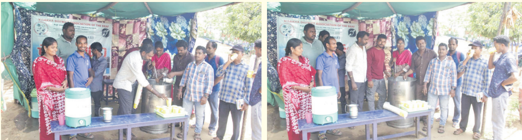
విశాఖపట్నం, మనసులోమాట, మే 31:

వేసవి తాపానికి తమ వంతు సహాయంగా బదిరులు పాదచారులకు మజ్జిగ పంపిణీ చేసే సేవా కార్యక్రమాల్లో ముందున్నారు. 'విశాఖ డిస్ట్రిక్ అసోసియేషన్ ఆఫ్ ద డేప్' ఆధ్వర్యం