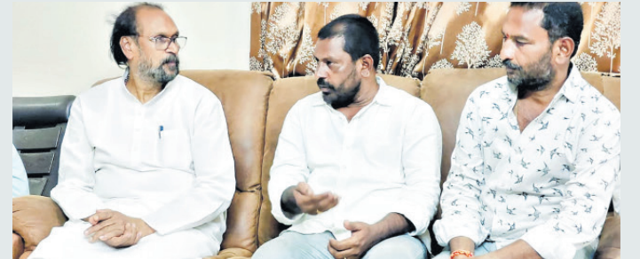
మునగపాక, మే 31, మనసులో మాట