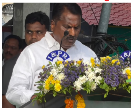
దినోత్సవాన్ని పురస్కరించుకొని జిల్లా ప్రజలందరికీ పూర్వం పూర్వక శుభాకాంక్షలు తెలిపారు. ఎన్నో త్యాగాలు, ఆకాంక్షలు, ఆత్మగౌరవ పోరాటాల ఫలితంగా ఆవిర్భవించిన తెలంగాణ రాష్ట్రం నేడు 12 సంవత్సరాల విజయవంతమైన ప్రస్థానాన్ని పూర్తి చేసుకుందని అన్నారు. ఈ సందర్భంగా తెలంగాణ సాధన కోసం తమ ప్రాణ త్యాగాల వలన తెలంగాణ రాష్ట్రంను కాంగ్రెస్ ప్రభుత్వం ఇచ్చింది అని అన్నారు.