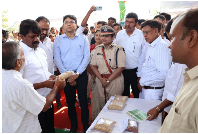
విత్తనాలను పరిశీలిస్తున్న దృశ్యం