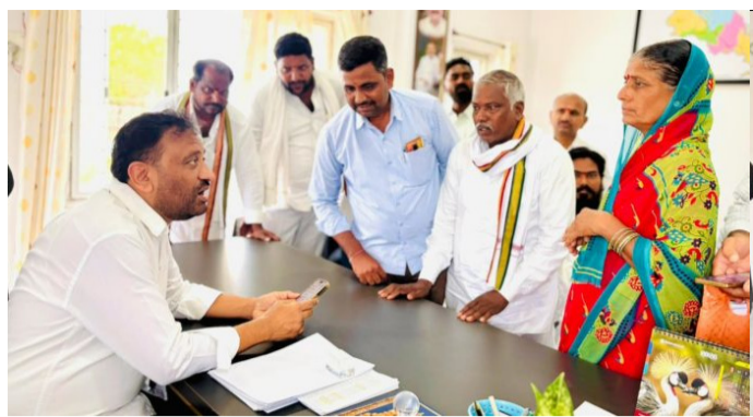
అమృత్ తెలంగాణ: మండల కేంద్రంలోని జుక్కల్ ఎమ్మెల్యే క్యాంపు కార్యాలయంలో ప్రజలను కలుసుకుని వారి సమస్యలను అడిగి తెలుసుకున్న జుక్కల్

ఎమ్మెల్యే తోట లక్ష్మీకాంత్ రావు అన్నారు. ప్రజా సమస్యల పరిష్కారమే తన ప్రధాన లక్ష్యమని పేర్కొన్నారు. ఈ సందర్భంగా ప్రజలు వినిపించిన సమస్యలను ఓర్పుగా అలకించి, సంబంధిత అధికారులతో మాట్లాడి వాటి పరిష్కారానికి తగిన చర్యలు తీసుకున్నారు. ప్రజలు తమ సమస్యలను నిర్భయంగా తన క్యాంపు కార్యాలయానికి వచ్చి విన్నవించుకోవచ్చని, వీలైనంతవరకు ప్రజల సౌకర్యార్థం తాను ప్రజలను కలిసే పనిలోనే ఉన్నానని చెప్పారు. వారి సమస్యలే తన సమస్యలుగా భావించి పరిష్కార మార్గం చూపించడానికి ప్రజలకు అందుబాటులో ఉంటున్నానని అన్నారు. అదేవిధంగా గ్రామాలలో జరుగుతున్న అభివృద్ధిని స్థానిక ప్రజాప్రతినిధులు నిత్యం ప్రజల్లోకి సంక్షేమ పథకాలు అందుతున్నాయో లేదో అని తెలుసుకోవాలని అన్నారు. సమస్యలను వాటికి అక్కడిక్కడే పరిష్కార మార్గం వెతకాలని మీ పరిధిలో లేని సమస్యలు ఉంటే తమ వరకు విన్నవించుకోవాలని స్థానిక నాయకులకు తెలిపారు. ఈ కార్యక్రమంలో నియోజకవర్గ సుందరి వచ్చిన వివిధ మండలాల లోని గ్రామాల ప్రజలను కలుసుకోవడం జరిగింది.