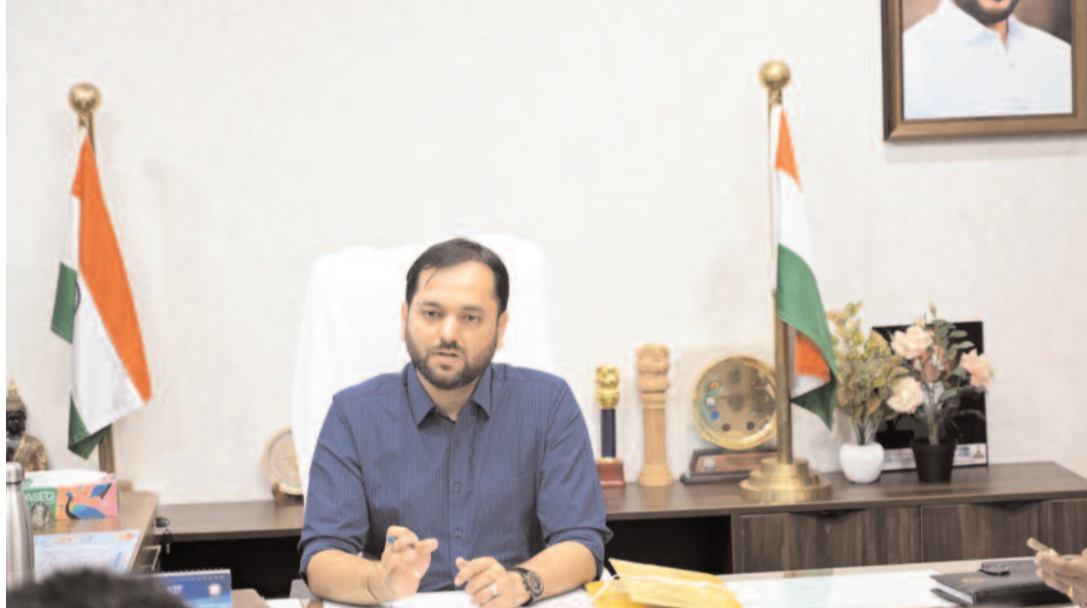
తీసుకోవాలని పేర్కొన్నారు. కొనుగోలు చేసిన ధాన్యానికి జిల్లాలోని రైతులు ప్రభుత్వ నాణ్యత ప్రమాణాలకు లోబడి ధాన్యాన్ని కొనుగోలు కేంద్రాలకు తీసుకురావాలని తెలిపారు. ఈ సమావేశం లో అదనపు కలెక్టర్ వెంకటాచారి, డి

జిల్లా కలెక్టర్ దీపక్ తివారి.. వికారాబాద్, మే,05(సమయం న్యూస్) : పరిధాన్యం కొనుగోలు ప్రక్రియ నిబంధనల ప్రకారం పకడ్బందీగా నిర్వహించాలని జిల్లా కలెక్టర్ దీపక్ తివారి అన్నారు. మంగళవారం కలెక్టర్ ఛాంబర్ లో అధికారులతో సమావేశము ఏర్పాటు చేశారు. ఈ సందర్భంగా కలెక్టర్ మాట్లాడుతూ జిల్లాలో కొనుగోలుతున్న పరిధాన్యం కొనుగోలు కేంద్రాలను త్వరితగతిన ప్రారంభించాలని, రైతు సంక్షేమం దిశగా ప్రభుత్వం చేపట్టిన పరిధాన్యం కొనుగోలు ప్రక్రియను నిబంధనల ప్రకారం పకడ్బందీగా నిర్వహించాలని తెలిపారు. రైతులు ధాన్యాన్ని తీసుకువచ్చే సమయంలో నిబంధనల ప్రకారం మట్టి గడ్డలు, తప్ప, తేమ ఇతర నిబంధనల ప్రకారం కొనుగోలు కేంద్రాలకు తీసుకురావాలని, రైతుల సౌకర్యాల కొనుగోలు కేంద్రాలలో త్రాగునీరు, నీడ, తూకం యంత్రాలు, ప్యాడి క్లీనర్లు, గౌనె సంచులు అందుబాటులో ఉంచాలని, ఇతర మౌళిక సదుపాయాలు కల్పించాలని తెలిపారు. ధాన్యం నాణ్యత ప్రమాణాలకు అనుగుణంగా ఉండే విధంగా పరిశీలించాలని తెలిపారు. రైతులు కేంద్రాలకు తీసుకొచ్చే ధాన్యాన్ని వెంటనే తూకం వేసి, అలస్యం లేకుండా, రైతులు వేచి చూసే పరిస్థితి రాకుండా కొనుగోలు చేయాలని ఆదేశించారు. కొనుగోలు చేసిన ధాన్యాన్ని తక్షణమే మిల్లలకు తరలించేలా చర్యలు