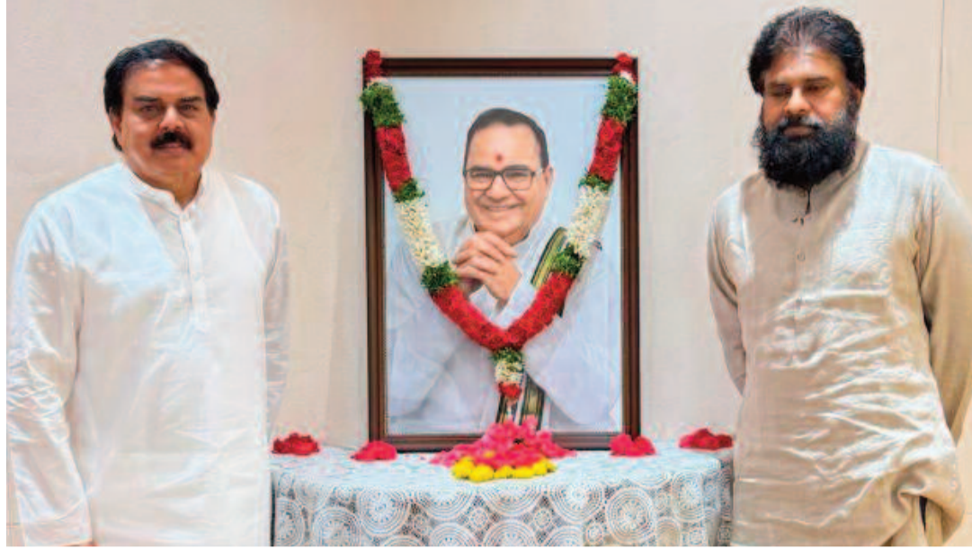
పలువురు నాయకులు కూడా పాల్గొని నివాళులు అర్పించారు. ఈ సందర్భంగా ఆయన జ్ఞాపకాలను స్మరించుకున్నారు. మాజీ ముఖ్యమంత్రికి అర్పించిన ఈ నివాళులు రాష్ట్ర రాజకీయ వర్గాల్లో సంతాప వాతావరణాన్ని నెలకొల్పాయి.