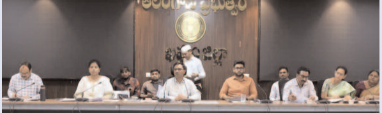
ఖమ్మం మే05(సమయం న్యూస్) : డ్రింకింగ్ వాటర్, సమ్మర్ యాక్షన్ ప్లాన్ పై అదనపు కలెక్టర్ డాక్టర్ పి.శ్రీజిత కలిసి సమీక్ష నిర్వహించారు. ఫీల్డ్ స్టాఫ్లో సమన్వయం పెంచి సిబ్బంది అందుబాటులో ఉండేలా చూడాలని, అధికారులు కార్యాలయాలకు పరిమితం కాకుండా ప్రజల్లోకి వెళ్లి సమస్యలను వెంటనే పరిష్కరించాలని సూచించారు. పైవేలైన్ లీకేజీలను తక్షణమే సరిచేయాలని, అవసరమైతే బోర్లెల్లు, ట్యాంకర్ల ద్వారా నీటి సరఫరా చేపట్టాలని ఆదేశించారు. హీల్ వేవ్ దృష్ట్యా ఒ.ఆర్.ఎస్ ప్యాకెట్లు అందుబాటులో ఉంచాలని, ప్రజా ప్రదేశాల్లో త్రాగునీరు కల్పించాలని పేర్కొన్నారు. సమావేశంలో వివిధ శాఖల అధికారులు పాల్గొన్నారు.

దీలూఖీ... కెమికల్స్, మెటీరియల్స్, ఇండస్ట్రీయల్ సొల్యూషన్స్, నర్సెస్ టెక్నాలజీస్, న్యూట్రీషన్ & కేర్, అగ్రికల్చరల్ సొల్యూషన్స్ తదితర రంగాల్లో... 200 దేశాల్లో కార్యకలాపాలు నిర్వహిస్తోంది.