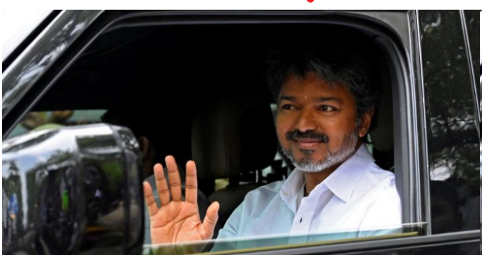
అమృత్ తెలంగాణ: మరోసారి తమిళనాడు గవర్నర్ ను రాజేందర్ విశ్వనాథ్ అర్రేకర్ ను టీవీకే అధినేత విజయ్ కలిశారు. 11 గంటలకు లోక్ భవన్ కార్యాలయానికి వెళ్లారు. ప్రభుత్వ ఏర్పాటు కోసం అవకాశం ఇవ్వాలని గవర్నర్ ను కోరారు. అయితే బుధవారం కూడా స్వయంగా విజయ్ ఆ రాష్ట్ర గవర్నర్ ను కలిశారు. ప్రభుత్వ ఏర్పాటుకు తగిన బలముందని వినతి వ్రతం కూడా అందజేశారు. కానీ గంటల వ్యవధిలోనే గవర్నర్ షాక్ ఇచ్చారు. ప్రభుత్వ ఏర్పాటు కావాల్సి 118 ఎమ్మెల్యేల సంఖ్యను తెలియజేయాలని నూచించారు. తాజాగా ఈరోజు మరోసారి అర్రేకర్ ను టీవీకే అధినేత విజయ్ కలిశారు. తాజా కలయితో గవర్నర్ ఏ నిర్ణయం తీసుకోనున్నారని ఉత్పంఠం నెలకొంది. అదే విధంగా బుధవారం విజయ్ కు భద్రతను పెంచిన ఆ రాష్ట్ర పోలీస్ శాఖ ఒక్కసారిగా ఉపసంహరించుకుంది. ప్రస్తుతానికి ఆయనకు నామమాత్రమైన బందోబస్తును కల్పించారు. మరోవైపు తన పార్టీ ఎమ్మెల్యేలను స్థానికంగా ఉన్న

మల్లాపూర్ లో ఓ రిసార్ట్ కు తరలించారు విజయ్. తన ప్రయివేటు భద్రత సిబ్బందితో టీవీకే ఎమ్మెల్యేలకు రిసార్ట్ వద్ద రక్షణగా పెట్టారు. 234 అసెంబ్లీ స్థానాలకు టీవీకే 107 సీట్లను కైవసం చేసుకున్న విషయం తెలిసింది. మ్యాజిక్ ఫిగర్ నెంబర్ 118కి అతి చేరువలో నిలిచిపోయింది. అయితే టీవీకే అభ్యర్థన మేరకు బయ్యరూరు ఎమ్మెల్యేలున్న కాంగ్రెస్ విజయ్ కు మద్దతు తెలిపింది. టీవీకే బలం 112కు చేరింది. అయినా కానీ ప్రభుత్వ ఏర్పాటుకు కావాల్సిన మెజారిటీ (118) రాకపోవడంతో తమిళనాడులో నాటికీయ పరిణామాలు చోటుచేసుకుంటున్నాయి. ఈ క్రమంలోనే డీఎంకే - అన్నాడీఎంకే కలిసి ప్రభుత్వాన్ని ఏర్పాటు చేయనున్నట్లు ఊహగానాలు తెరమీదకు వచ్చాయి. అయితే డీఎంకే అధినేత ఎంకే స్టాలిన్ విజయ్ ప్రభుత్వ ఏర్పాటును అడ్డుకోవాలని స్పష్టం చేశారు.