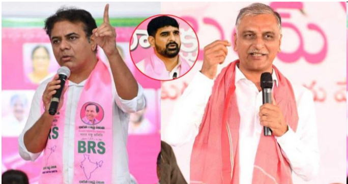
అమృత్ తెలంగాణ: కరీంనగర్ టీఆర్ఎస్ ఎమ్మెల్యే క్యాంప్ కార్యాలయంపై బండి సంజయ్ అనుచరుల దాడిని కేటీఆర్, హరీశ్ రావు తీవ్రంగా ఖండించారు.