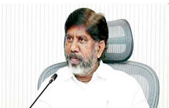
అమృత్ తెలంగాణ: రైతుల నుంచి మక్కుజొన్న, జొన్న పంటను సేకరించి, రేషన్ షాపుల ద్వారా పేదలకు పంపిణీ చేసే ఆలోచన చేస్తున్నట్లు డిప్యూటీ సీఎం మల్లు భట్టి విక్రమార్క వెల్లడించారు. తద్వారా ఆ పంటలు పండిస్తున్న రైతులకు

పేదలకు శౌష్ఠికాహారం.. మధ్యవర్తుల దండాకు చెక్ : డిప్యూటీ సీఎం మల్లు భట్టి విక్రమార్క