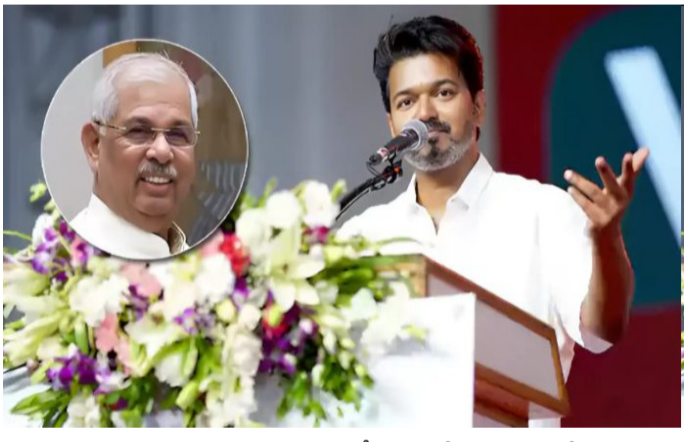
అమృత్ తెలంగాణ: తమిళనాడు రాజకీయాల తీవ్ర ఉత్పంఠం రేపుతున్నాయి. ఎన్నికల్లో అద్భుత విజయం సాధించిన నటుడు విజయ నేతృత్వంలోని తమిళగ వెల్లి కళగం (టీవీకే) ప్రభుత్వ ఏర్పాటుకు అవసరమైన సంఖ్యాబలంపై నెస్టెన్స్ కొనసాగుతోంది. మిత్రపక్షాల మద్దతుతో ప్రభుత్వాన్ని ఏర్పాటు చేస్తామని విజయ్ చేస్తున్న వాదనతో గవర్నర్ ఆర్వీ అర్రేకర్ ఇంకా సంతృప్తి చెందలేదు. దీంతో ప్రభుత్వ

ఏర్పాటు ప్రక్రియలో ప్రతిష్టంభన నెలకొంది. గురువారం ఉదయం రాజ్ భవన్ కు విజయ్ ను పిలిపించిన గవర్నర్ అర్రేకర్, ఆయన ముందు పలు కీలక ప్రశ్నలు ఉంచారు. అసెంబ్లీలో మెజారిటీకి 118 మంది ఎమ్మెల్యేల మద్దతు అవసరం కాగా, కేవలం 108 మంది నభ్యులున్న టీవీకే ఎలా ప్రభుత్వాన్ని నడుపుతుందని గవర్నర్ ప్రశ్నించినట్లు సమాచారం. ఏమీ పార్టీలు మీకు మద్దతు ఇస్తున్నాయో స్పష్టం చేయాలని కోరారు. బుధవారం కూడా విజయ్ తో భేటీ అయిన గవర్నర్, ఆయన ప్రతిపాదనను తిరస్కరించిన విషయం తెలిసింది.