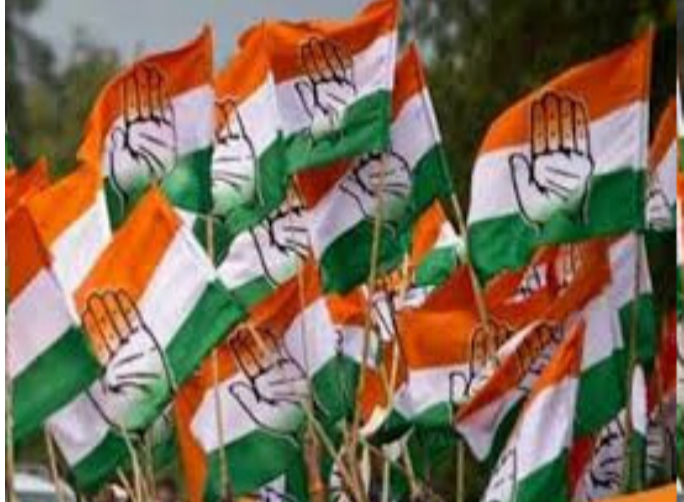
అమృత్ తెలంగాణ: తమిళనాడు రాజకీయాలు ఆసక్తికరంగా మారాయి. 2026 అసెంబ్లీ ఎన్నికల్లో అతి పెద్ద పార్టీగా అవతరించిన తమిళగ వెల్లి కళగం (టీవీకే) పార్టీని ప్రభుత్వ ఏర్పాటుకు ఆహ్వానించడంలో జాప్యం జరుగుతోందని ఆరోపిస్తూ కాంగ్రెస్ పార్టీ ఆందోళనకు పిలుపునిచ్చింది. కేంద్రంలోని బీజేపీ ప్రభుత్వం, గవర్నర్ రాజ్యాంగ విరుద్ధంగా వ్యవహరిస్తున్నారని నిరసిస్తూ రేపు (మే 8వ తేదీన) చెన్నైలో