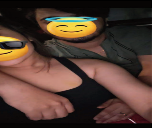
సంజయ్ కు సన్ స్ట్రోక్.

బాధితురాలి తల్లిదండ్రులు మేడ్చల్ జిల్లాలోని పేట బహిరంగ పోలీసులను ఆశ్రయించి సంచలన ఆరోపణలు చేశారు. తమ మైనర్ కూతురిని (17 ఏళ్లు) మొయినాబాద్ లోని ఒక ఫామ్ హౌస్ కు మరియూ మరో రెండు ప్రాంతాలకు తీసుకెళ్లి, అక్కడ ఆమెకు మద్యం తాగించి లైంగిక దాడికి పాల్పడ్డాడని వారు ఫిర్యాదులో పేర్కొన్నారు. ఈ వేధింపుల కారణంగా తమ కుమార్తె తీవ్ర మానసిక ఒత్తిడికి లోనై రెండుసార్లు ఆత్మహత్యాయత్నానికి కూడా పాల్పడిందని వారు ఆవేదన వ్యక్తం చేశారు. పోలీసులు మొదట కేసు నమోదులో తాత్కాలికం చేసినా, బాధితులు కోర్టును ఆశ్రయిస్తామని హెచ్చరించడంతో బీఎస్ఎస్ 74, 75 సెక్షన్లతో పాటు పోక్సో చట్టంలోని సెక్షన్ 11, 12 కింద ఎఫ్ఐఆర్ నమోదు చేశారు.