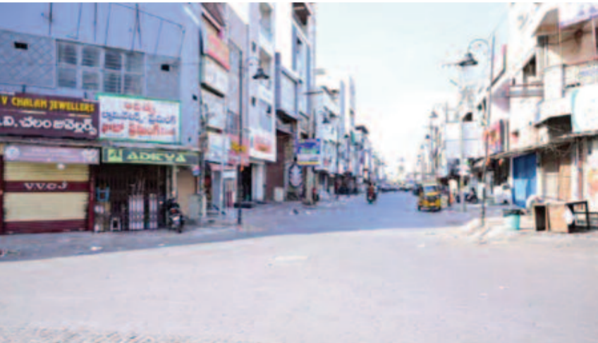
కలీంగర్ లో బండ్ కు మద్దతు తెలిపే వ్యాపారులు.