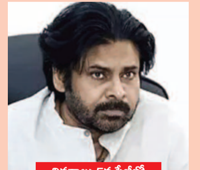
వివరాలు 5వ పేజీలో