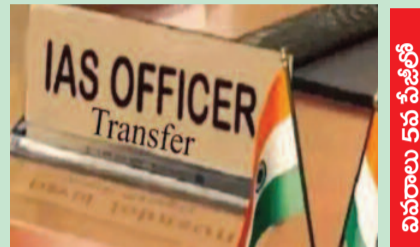
వివరాలు 5వ పేజీలో