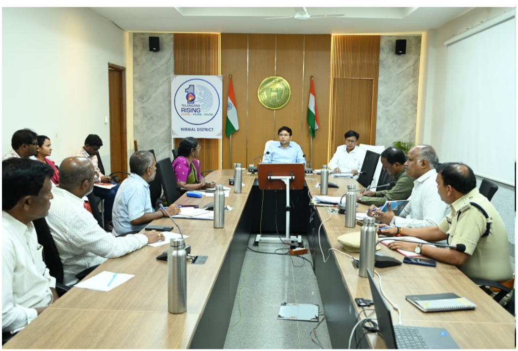
ధాన్యం తరలింపులో జాప్యం వద్దు అధికారులతో కలెక్టర్ సమీక్ష సమావేశం

నిర్మల్ జిల్లా మే 11 అమృత్ తెలంగాణ నిర్మల్ జిల్లా లో కొనుగోలు కేంద్రాల నుంచి వరి ధాన్యం తరలింపు ప్రక్రియలో ఎలాంటి ఆలస్యం జరగకూడదని జిల్లా కలెక్టర్ భవేష్ మిశ్రా అధికారులను ఆదేశించారు. సోమవారం కలెక్టరేట్ సమావేశ మందిరంలో ధాన్యం సేకరణ, రవాణాపై సంబంధిత శాఖల అధికారులతో ఆయన సమీక్ష సమావేశం నిర్వహించారు. ఈ సందర్భంగా కలెక్టర్ మాట్లాడుతూ, రైతుల నుంచి సేకరించిన ధాన్యాన్ని ఎప్పటికప్పుడు మిల్లులకు తరలించాలని, కొనుగోలు కేంద్రాల్లో ఎక్కువకాలం నిల్వ ఉంచరాదని స్పష్టం చేశారు. రానున్న రోజుల్లో ధాన్యం రాక మరింత పెరిగే అవకాశం ఉన్నందున ముందస్తు ప్రణాళికతో అదనపు లారీలను నిర్ణయం చేసుకోవాలని సూచించారు.