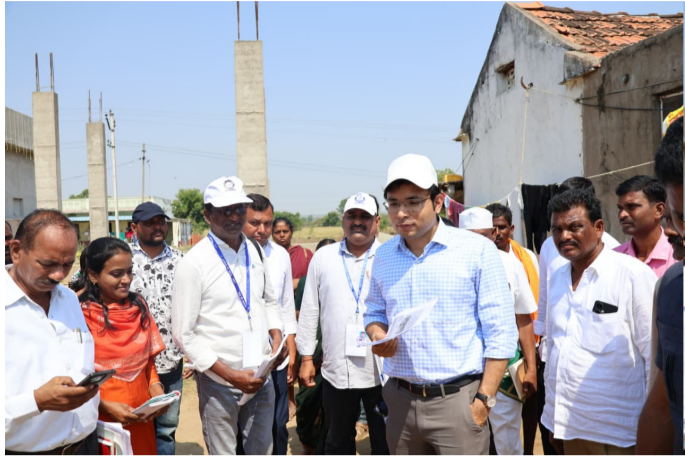
జిపిఓ లు జనగణన అధికారులను వెంబడి ఉండాలని పేర్కొన్నారు. జనగణన అధికారులకు అందించిన ఎన్యూఐఆర్ కిట్ లను పరిశీలించారు. జనగణన అధికారులు తప్పనిసరిగా తమ వెంట ఓఆర్ఎస్ పోస్టల్స్ ఉంచుకోవాలని సూచించారు. ఎండలు అధికంగా ఉన్నాయని,

నిర్మల్ జిల్లా మే 11 అమృత్ తెలంగాణ నిర్మల్ జిల్లాలో జనగణన ప్రక్రియలో భాగమైన హౌస్ లిస్టింగ్ ప్రక్రియను పక్కకుదిగి పూర్తి చేయాలని జిల్లా కలెక్టర్ భవేష్ మిశ్రా అధికారులను ఆదేశించారు. సోమవారం ఉదయం, నిర్మల్ గ్రామీణ మండలం తల్వేర గ్రామంలో జనగణనకు సంబంధించి చేపట్టిన హౌస్ లిస్టింగ్ ప్రక్రియ తీరును కలెక్టర్ పరిశీలించారు. ఈ సందర్భంగా కలెక్టర్ మాట్లాడుతూ, హౌస్ లిస్టింగ్ ప్రక్రియకు సంబంధించి వివరాలను అధికారులను అడిగి తెలుసుకున్నారు. జనగణన ప్రక్రియలో ఇండ్ల గణన అనేది అత్యంత కీలకమని అన్నారు. నిర్ణీత గడువులోగా హౌస్ లిస్టింగ్ ప్రక్రియను ఎటువంటి పొరపాట్లు లేకుండా పూర్తి చేయాలని వివరించారు. నిబంధనల ప్రకారం జనగణనకు సంబంధించి ఇంటి సంబంధన కేటాయింపులను చెప్పారు. స్థానిక పంచాయతీ కార్యదర్శి,