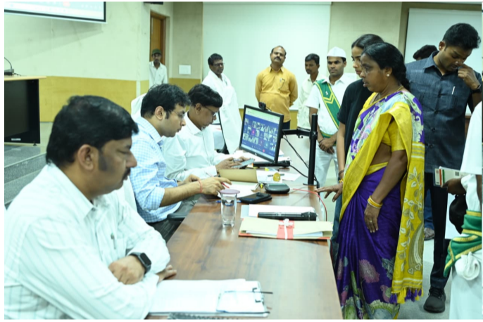
నిర్మల్ జిల్లా కలెక్టరేట్లో ప్రజావాణిలో ఫిర్యాదుదారుల దరఖాస్తులు స్వీకరిస్తున్న కలెక్టర్

విద్యా వారోత్సవాల్లో అధికారులు భాగస్వాములు కావాలి: జిల్లా కలెక్టర్ భవేష్ మిశ్రా