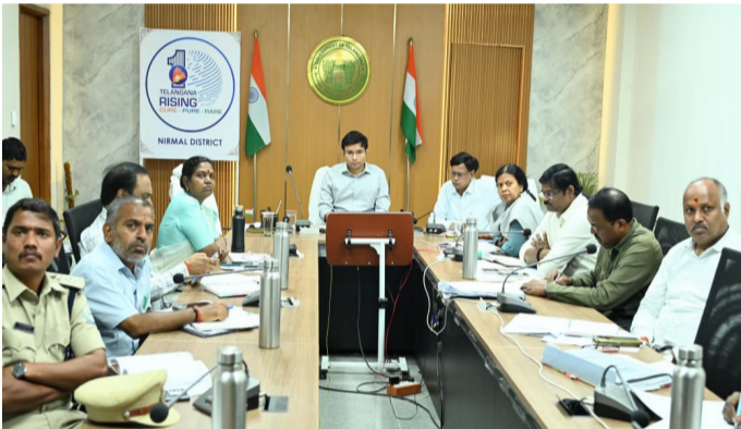
జిల్లా అధికారులతో సమీక్ష సమావేశం