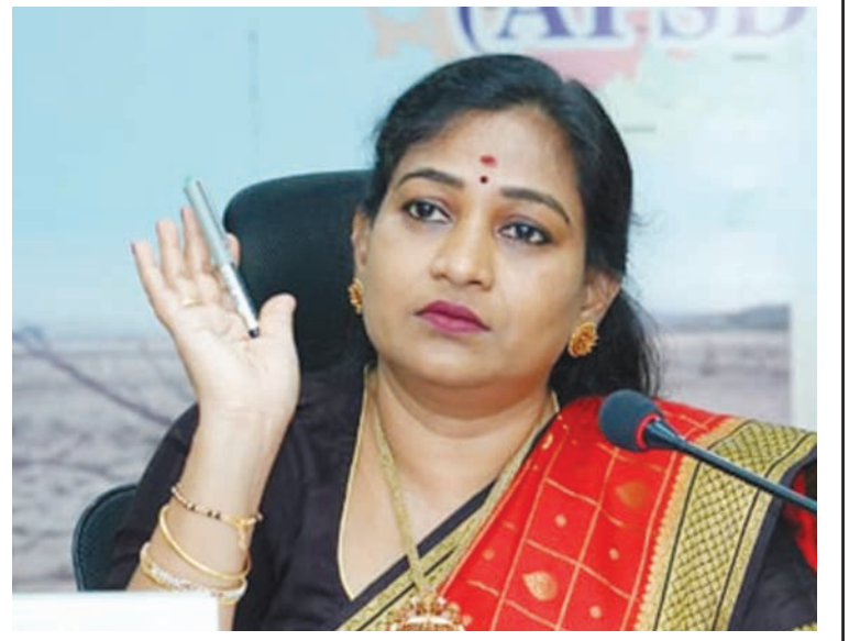
- మిగతా 2లో..

దుర్వినియోగం కాకుండా చూడడమే లక్ష్యమని ఈ నిబ్బంది పడుతున్న ఇబ్బందులపై మంత్రి ప్రత్యేక శ్రద్ధ సందర్భంగా ఆయన పేర్కొన్నారు. శాఖలోని క్షేత్రస్థాయి చూపారు. వైద్య సిబ్బందికి