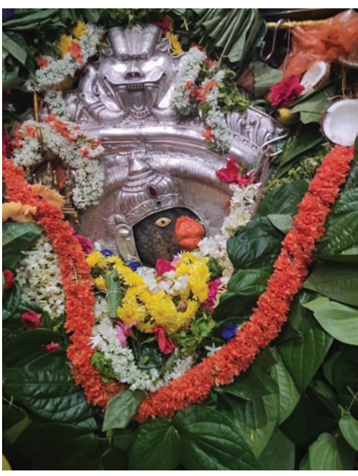
మూర్తి ద్వారా జరుగుతున్నాయి. ప్రస్తుతం ఈ ఆలయం రోడ్డుకు ఐదు అడుగుల క్రింద వుండడం విశేషం. అనగా 600సంవత్సరాలూ రోడ్డు ఐదు అడుగుల ఎత్తు పెరిగిందన్న మాట.

పలమనేరు, ఆంధ్రనాడు, మే 12: పట్టణంలో మంగళవారం శ్రీ హనుమాన్ జయంతిని పురస్కరించుకొని ఆంజనేయస్వామి దేవాలయాలలో ప్రత్యేక పూజలు, అభిషేకాలు ఘనంగా నిర్వహించారు. ముఖ్యంగా బజారు వీధిలోని అభయాంజనేయ స్వామి దేవాలయంలో ప్రత్యేక పూజలు నిర్వహించడం, భారీ ఎత్తున భక్తులకు, దారిన వెళ్లేవారికి ప్రసాద వినియోగాలలో భాగంగా పొంగలి, పెరుగు అన్నం, మజ్జిగ పాకెట్స్, వాటర్ ప్యాకెట్లు అందించి జై శ్రీ రామ్ అంటూ నినదించి సందడి చేశారు. అభయాంజనేయస్వామి దేవాలయం ప్రత్యేకత ఈ దేవాలయాన్ని 600 సంవత్సరాల పూర్వం శ్రీ కృష్ణ దేవరాయలు ఆస్థానంలో ముఖ్యులుగా పున్న వ్యాసరాయలు విజయనగరం నుంచి తిరుమల ఏడుకొండలు, కాశీయాత్రకు తమ పరివారంతో సడకదారిన బయలు దేరేవారు. అలా వారు దారిన వెళుతూ ఈ ఆలయం ఆవరణలో విడిదిచేసారు. ఇలా రెండు వారాల వరకూ ఇక్కడే బసచేసారని పురాణాలు చెబుతున్నాయి. ఈ సందర్భంలో వారితో వుండే శిల్పాలు ఇక్కడి రాతి బండపై అభయాంజనేయ స్వామిని చెక్కి ప్రతిష్ఠించారు. వీరు చెక్కే అభయాంజనేయ స్వాముల చేతిలో సౌగంధికా పువ్వు, తోకలో గంట వుండేలా చెక్కేవారు. ఇలా బండపై చెక్కిన అభయాంజనేయ స్వామికి నేడు నిత్యం విశేష పూజలు అర్చకులు రాసు పెరిగిందన్న మాట.