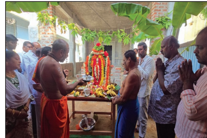
పీలేరు ఆంజనేయస్వామి ఆలయంలో.... హనుమాన్ జయంతిని పురస్కరించుకుని

రామకుప్పం మండలంలో.... శ్రీ హనుమాన్ జయంతి సందర్భంగా పలు దేవాలయాల్లో విశేష పూజలు నిర్వహించారు మిట్టపల్లి, పిల్లిగుట్టలు, రాజుపేట విజలాపురం ఇంకా పలు గ్రామాలలో శ్రీరామ భక్త ఆంజనేయ స్వామికి ఉదయమే అభిషేక పూజలు హోమాలు నిర్వహించారు రాజుపేట గ్రామంలో సాంస్కృతిక కార్యక్రమాలను భాగంగా కోలాటాలు ప్రదర్శన కూడా నిర్వహించారు అనంతరం అన్న సంతర్పణ చేపట్టారు పలు దేవాలయాల్లో స్వామివారికి విశేష అలంకరణ విద్యుత్ దీప లతో చేశారు హనుమజ్జయంతి ఉత్సవాలను ఘనంగా గ్రామస్థులు దేవాలయ కమిటీ వారు నిర్వహించారు.