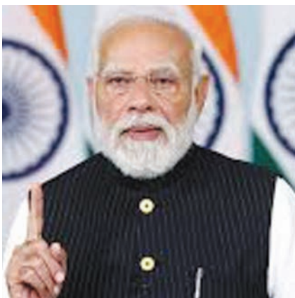
- మిగతా 2లో..

అంతర్జాతీయ వేదికపై భారత దౌత్య పటిమను చాటితూ ప్రధాని మంత్రి నరేంద్ర మోదీ ఆరు రోజుల పాటు ఐదు కీలక దేశాల్లో పర్యటించనున్నారు. మే 15వ తేదీన యునైటెడ్ అరబ్ ఎమిరేట్స్ (యుఏఈ)లో ప్రారంభమయ్యే ఈ పర్యటన నెదర్లాండ్స్, స్వీడన్, నార్వేల మీదుగా సాగి మే 20వ తేదీన ఇటలీలో ముగియనుంది. మరి ఈ ఐదు దేశాల పర్యటనలో భాగంగా మోదీ ఎలాంటి నిర్ణయాలు తీసుకోబోతున్నారో, మే 15వ తేదీన ప్రధాని మోదీ తొలుత యూపీఈ అధ్యక్షుడిని కలుస్తారు. ఇంధన సహకారం, వాణిజ్యం, 4.5 మిలియన్ భారతీయ సమాజ సంక్షేమంపై చర్చించనున్నారు.