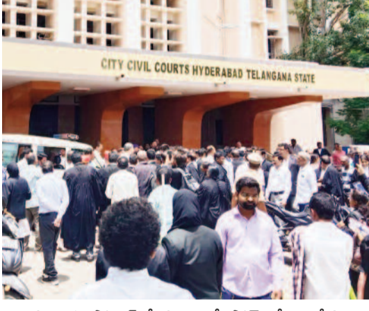
ఇప్పటివరకు సోషల్ మీడియాలో పోస్ట్ చేసిన వీడియో క్లిప్పింగులు, డిజిటల్ కంటెంట్, వ్రతీకా కలింగులు, వాల్ పోస్టర్లు తక్షణం తొలగించాలని స్పష్టం చేసింది. ఈ నెల

సిటీ సివిల్ కోర్టు కీలక ఉత్తర్వులు ఆయన ప్రతిష్ఠను దెబ్బతీసే పోస్టులు, వీడియోలను తక్షణమే తొలగించాలి ఈనెల 26లోగా చర్యలు తీసుకోకుంటే చట్టపరమైన చర్యలు తప్పవని హెచ్చరిక