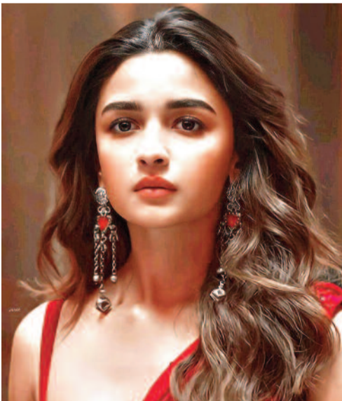
బాలీవుడ్ ప్రముఖ నటి అలియా భట్ అంతర్జాతీయ సినీ ఉత్సవ వేదికపై చేసిన వ్యాఖ్యలు ఇప్పుడు సినీ వర్గాల్లో పెద్ద చర్చకు దారితీశాయి. భారతీయ చిత్ర పరిశ్రమలో ఇప్పటికే

పురుషాధిక్యత కొనసాగుతోందని ఆమె చేసిన వ్యాఖ్యలు సామాజిక మాధ్యమాలలో వైరల్ గా మారాయి. సినిమాల్లో కథ కంటే హీరోలకు ఎక్కువ ప్రాధాన్యత ఇస్తున్నారని అలియా అభిప్రాయపడ్డారు. చాలా చిత్రాలు ఇప్పటికీ హీరో చుట్టూనే తిరుగుతున్నాయని, కథ బలంగా ఉండటమే అసలు ముఖ్యమని ఆమె పేర్కొన్నారు. సినిమాను విజయవంతం చేసేది కేవలం హీరో కాదని, మంచి కథే ప్రేక్షకులను ఆకట్టుకుంటుందని చెప్పారు. ఆమె వ్యాఖ్యలకు సామాజిక మాధ్యమాలలో భిన్న స్పందనలు వస్తున్నాయి. కొందరు అలియా ధైర్యంగా నిజం మాట్లాడిందని ప్రశంసిస్తుండగా, మరికొందరు మాత్రం తీవ్ర విమర్శలు చేస్తున్నారు. భారతీయ సినిమాను తక్కువ చేసి మాట్లాడుతున్నారని కొందరు అభిప్రాయపడుతున్నారు. ఇక ఆమె భర్త నటించిన కొన్ని చిత్రాల్లో కూడా పురుషాధిక్యత కనిపించిందని, అలాంటి సినిమాలపై ఎందుకు స్పందించలేదని నెటిజన్లు ప్రశ్నిస్తున్నారు. పరిశ్రమలో మార్పు గురించి మాట్లాడేవారు ముందుగా తమ చుట్టూ ఉన్న విషయాలపై స్పందించాలని కొందరు వ్యాఖ్యానిస్తున్నారు. మరోవైపు అలియా చెప్పిన విషయాల్లో నిజం ఉందని పలువురు సినీ అభిమానులు అభిప్రాయపడుతున్నారు. హీరోలకు భారీ పారితోషికాలు, ప్రత్యేక ప్రాధాన్యత, విస్తృత ప్రచారం లభిస్తున్నప్పటికీ హీరోయిన్లకు సమాన గుర్తింపు దక్కడం లేదని చర్చ జరుగుతోంది. గతంలో కూడా పలువురు నటీమణులు సినీ పరిశ్రమలో మహిళలకు సరైన ప్రాధాన్యత దక్కడం లేదని బహిరంగంగానే వ్యాఖ్యానించారు. ఇప్పుడు అలియా వ్యాఖ్యలతో మరోసారి భారతీయ సినిమాల్లో కథలకు ప్రాధాన్యత పెరగాల్సిన అవసరంపై చర్చ మొదలైంది.