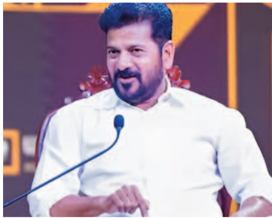
అని స్పష్టం చేశారు. కాంగ్రెస్ ముందు ప్రకటించి తర్వాత

శుక్రవారం హైదరాబాద్ వేదికగా సీఎం మాట్లాడారు. టీడీపీలో పదేళ్లు పనిచేశానని.. సీఎం చంద్రబాబు ఇప్పటికీ తనను గౌరవిస్తారని ప్రస్తావించారు. పార్టీని వదిలిపెట్టిన తర్వాత నాయకుల మధ్య మంచి సంబంధాలు ఉండటం చాలా అరుదని తెలిపారు.. పార్టీని వదిలిపెట్టే సమయంలో విజయవాడకు వెళ్లి చంద్రబాబుకు చెప్పి వచ్చానని గుర్తుచేశారు.. కాంగ్రెస్ను దేశంలో అధికారంలోకి తేవాలని రాహుల్ గాంధీకి లక్ష్యం ఉందని...కానీ ప్రధాని కావాలన్న లక్ష్యం లేదని స్పష్టం చేశారు. వికారాబాద్లో జరిగిన కాంగ్రెస్ సమావేశంలో ప్రధాని పదవి తీసుకోవాలని తానే రాహుల్ గాంధీకి చెప్పి ఒప్పించానని ప్రస్తావించారు. ఇప్పుడు జనం స్పీగ్ పాలిటిక్స్ కోరుకుంటున్నారని అన్నారు. వచ్చే ఎన్నికల్లో ఇండియా కూటమి నుంచి ప్రధాని అభ్యర్థి రాహుల్ గాంధీనే