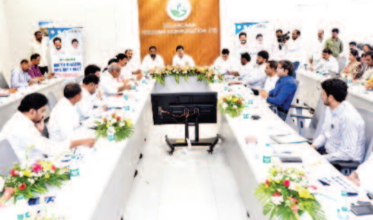
ఇది ఇక్కడితో ఆగిపోదని, అర్జున ప్రతి లక్షిదారునికి ఇల్లు అందే వరకు మూడో, నాలుగో విడతలుగా కొనసాగుతుందని స్పష్టం చేశారు. ఉమ్మడి రాష్ట్రంలో ఇందిరమ్మ పథకం కింద రూ.20 వేల వరకు సాయం అందిన వారికి కూడా మళ్లీ ఇందిరమ్మ ఇండ్ల మంజూరు చేస్తామని తెలిపారు. ఫైల్ లో గ్రామంలో 600 చదరపు అడుగులకు పైగా నిర్మించిన

గూడులేని వ్రతీ అర్ధ పేద కుటుంబానికి సొంత ఇల్లు కల్పించడమే ప్రభుత్వ లక్ష్యమని పేర్కొన్నారు. దేశంలో ఏ రాష్ట్ర ప్రభుత్వం ఇప్పటి వరకూ ఒక్కో ఇంటికి రూ.5 లక్షల ఆర్థిక సాయం అందిస్తూ తెలంగాణ ప్రభుత్వం పేదల గృహనిర్మాణంలో దేశానికి ఆదర్శంగా నిలుస్తోందన్నారు. తొలి విడతలో 3 లక్షలకు పైగా ఇండ్లను మంజూరు చేశామని, అందులో 2.90 లక్షల ఇండ్లకు గ్రౌండింగ్ పూర్తి కాగా ఇప్పటికే సుమారు 50 వేల గృహప్రవేశాలు బరిగాయని తెలిపారు. మరో రెండు లక్షలకు పైగా ఇండ్లు వివిధ దశల్లో నిర్మాణంలో ఉన్నాయని, రెండు నెలల్లో పూర్తి అవుతాయని చెప్పారు. ప్రతి నియోజకవర్గానికి 3,500 ఇండ్లు మంజూరు చేసినట్లు మంత్రి వెల్లడించారు. బిడీపీ ప్రాంతాల నియోజకవర్గాలకు అదనపు ఇండ్లు కేటాయింపినట్లు తెలిపారు. రెండో విడత ఇందిరమ్మ ఇండ్ల మంజూరు కార్యక్రమాన్ని జూన్ 2న ఆదిలాబాద్ జిల్లాలో ప్రారంభిస్తామని పేర్కొన్నారు.