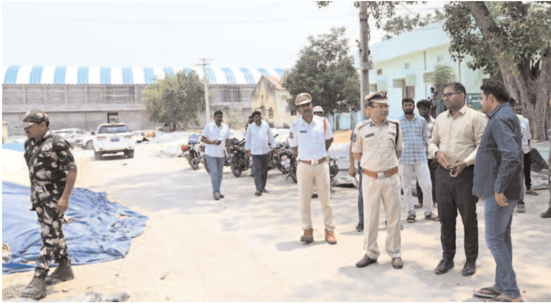
మొక్కజొన్న కొనుగోళ్ల కోసం 8 కేంద్రాల ప్రారంభించామని, రైతుల ట్రాక్టర్ల ద్వారా గోదాములకు తరలించినా రవాణా చార్జీలు చెల్లిస్తామని చెప్పారు. అనంతరం సుల్తానాబాద్ మండలం దుబ్బుపల్లి చెక్ పోస్టును కలెక్టర్ తనిఖీ చేసి, బక్రీడ్ నేపథ్యంలో అక్రమ ఆవుల రవాణా జరగకుండా పటిష్ట బందోబస్తు ఏర్పాటు చేయాలని అధికారులను ఆదేశించారు.

పెద్దపల్లి, మే 15(సమయం న్యూస్) : రైతుల వద్ద ఉన్న చివరి గింజ వరి, మొక్కజొన్న పంటను కూడా మద్దతు ధరతో కొనుగోలు చేస్తామని జిల్లా కలెక్టర్ కోయ శ్రీహర్ష స్పష్టం చేశారు. శుక్రవారం రామగుండం పోలీస్ కమిషనరీ అంబర్ కిశోర్ రూమ్ కలిసి పెద్దపల్లిలోని అన్నపూర్ణ రైస్ మిల్, పెద్దబొంకూరులోని రాఘవేంద్ర రైస్ మిల్తో పాటు పలు మిల్లులు, పెద్దపల్లి వ్యవసాయ మార్కెట్ యార్డులోని కొనుగోలు కేంద్రాలను పరిశీలించారు. ఈ సందర్భంగా కలెక్టర్ మాట్లాడుతూ జిల్లాలో ఇప్పటివరకు 1.6 లక్షల మెట్రిక్ టన్నుల ధాన్యం కొనుగోలు చేసి, రైతులకు రూ.280 కోట్ల చెల్లింపులు చేసినట్లు తెలిపారు. మే 20 నాటికి 80 శాతం ధాన్యం కొనుగోళ్లు పూర్తి చేస్తామని చెప్పారు. రోజువారీ కొనుగోళ్లు 6 వేల మెట్రిక్ టన్నుల నుంచి 13 వేల మెట్రిక్ టన్నులకు పెంచినట్లు తెలిపారు. రవాణా, హమాల్ సమస్యల పరిష్కారానికి ప్రత్యేక చర్యలు తీసుకున్నామని, హమాల్ కులీని ఒక్కో సంచికి రూ.6 నుంచి రూ.8.50కు పెంచినట్లు పేర్కొన్నారు. గన్నీ పంటలు తీసుకువచ్చే రైతులకు ఒక్కో సంచికి రూ.21 చెల్లిస్తామని తెలిపారు. తడిసిన ధాన్యాన్ని కూడా మద్దతు ధరతో కొనుగోలు చేస్తున్నామని, రైతులు అందోళన చెందవద్దని కలెక్టర్ భరోసా ఇచ్చారు. జిల్లాలో