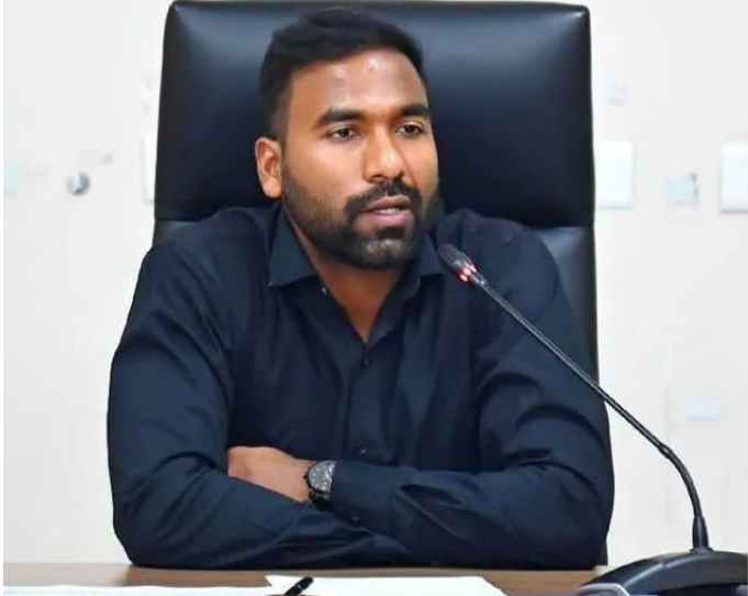
జగిత్యాల అమృత్ తెలంగాణ మే 16: జిల్లాలో ఇప్పటివరకు 2.85 లక్షల