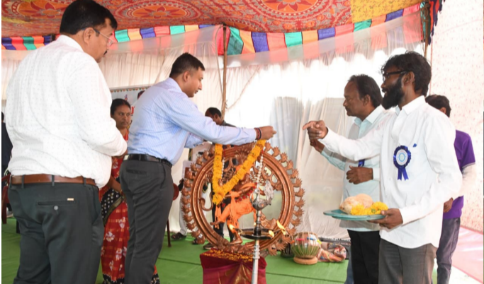
ఫలమాల వేస్తున్న ఆదిలాబాద్ జిల్లా కలెక్టర్ దృశ్యం