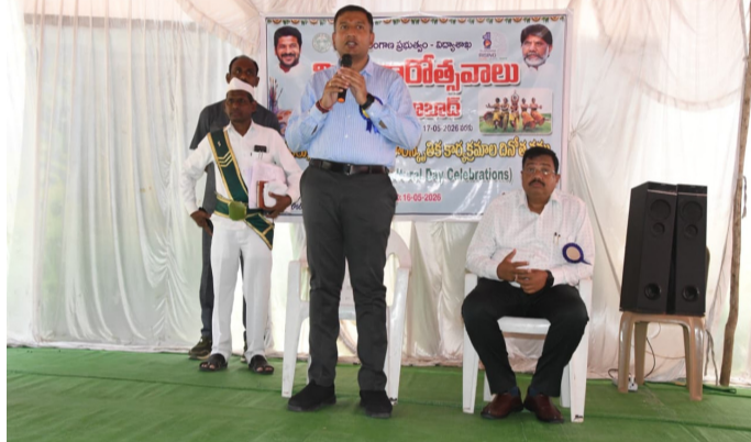
సమావేశంలో మాట్లాడుతున్న ఆదిలాబాద్ కలెక్టర్ రాజర్షిషా