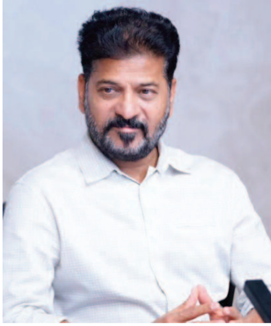
దేశంలో ఇలాంటి గడ్డు పరిస్థితులు ఉన్న తరుణంలో, అంతర్జాతీయంగా ఇరాన్ - ఇజ్రాయిల్ మధ్య జరుగుతున్న

ఆయన పేర్కొన్నారు. సరేంద్ర మోడి సారథ్యంలోని కేంద్ర ప్రభుత్వం తాజాగా తీసుకున్న పెట్రోల్, డీజిల్ ధరల పెంపు నిర్ణయం ఏ మాత్రం సమర్థనీయం కాదని సోషల్ మీడియా 'ఎక్స్' (ట్విట్టర్) వేదికగా సీఎం తీవ్ర అభ్యంతరం వ్యక్తం చేశారు. కేంద్ర ప్రభుత్వ అనాలోచిత నిర్ణయం దేశంలోని అనేక రంగాలపై తీవ్ర వ్యతిరేక ప్రభావం చూపుతుందని ఆయన ఆవేదన వ్యక్తం చేశారు. మోడి ప్రభుత్వ అసమర్థ పాలన, అనాలోచిత ఆర్థిక విధానాల కారణంగా దేశ ఆర్థిక వ్యవస్థ పూర్తిగా కుదేలైందని ముఖ్యమంత్రి రేవంత్ రెడ్డి విమర్శించారు. కేంద్రం చెబుతున్న 'అత్యునికర్ణ భారత్' కేవలం ఓట్లు రాల్చే నినాదమే తప్ప, క్షేత్రస్థాయిలో ఎలాంటి ఫలితాలు సాధించని పాలసీ అని ఇప్పుడిప్పుడే తేలిపోయిందని ఎద్దేవా చేశారు. కేంద్ర ప్రభుత్వ నిర్ణయాల వల్ల దేశంలో చిన్న మధ్య తరహా పరిశ్రమలు దెబ్బతిన్నాయని, దేశీయ యువత ఉపాధికి గ్యారంటీ లేని దారుణ పరిస్థితి దాపురించిందని వ్యాఖ్యానించారు. అస్సాదాతల ఆదాయాల రెడ్డింపు చేస్తామంటూ గతంలో ఇచ్చిన హామీ ఒట్టి మాటగానే మిగిలిపోయిందని మండిపడ్డారు. గత పదేళ్లుగా అంతర్జాతీయ మార్కెట్లో రూపాయి విలువ నిరంతరం పతనమవుతూ వస్తోందని, ఇప్పుడు ఆ పతనం పరాకాష్ఠకు చేరిందని ఆరోపించారు.