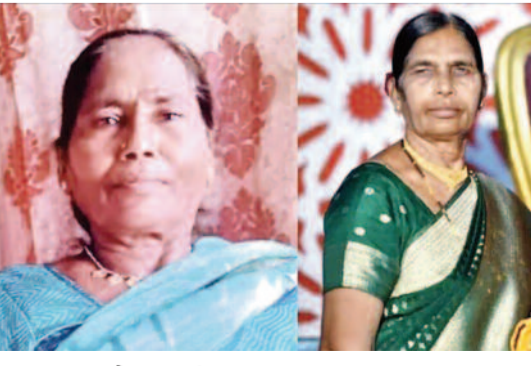
అందుగా ప్రాంతానికి చెందిన అదృశ్యమైన ఇద్దరు వృద్ధ మహిళలుగా పోలీసులు ప్రాథమికంగా గుర్తించినట్లు సమాచారం. వీరి వయసు సుమారు 60 సంవత్సరాల

రంగారెడ్డి, మే 16: రంగారెడ్డి జిల్లా మొయినాబాద్ పరిధిలోని ఓ ఫామ్ హౌజ్ లో ఇద్దరు వృద్ధ మహిళలు హత్యకు గురైన ఘటన తీవ్ర కలకలం రేపింది. గుర్తుతెలియని వ్యక్తులు అత్యంత దారుణంగా హత్య చేసిన ఈ ఘటన స్థానికంగా భయాందోళనలకు గురిచేస్తోంది. సమాచారం అందుకున్న పోలీసులు వెంటనే ఘటనాస్థలికి చేరుకుని పరిశీలించారు. మృతదేహాలను స్వాధీనం చేసుకుని పోస్టుమార్టం నిమిత్తం ఆసుపత్రికి తరలించారు. హత్యకు గురైన మహిళలను