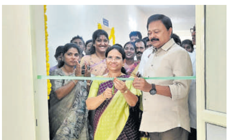
గూడూరు (మనసులో మాట) మే 17: పేదవారు నివసించే ప్రాంతంలో అందరికీ అందుబాటులో పెద్ద మసీదు వద్ద

అర్బన్ హెల్త్ సెంటర్ను ప్రారంభించడం సంతోషంగా ఉందని పెండింగ్లో ఉన్న అభివృద్ధి పనులన్నీ కూటమి ప్రభుత్వం వచ్చిన తర్వాత పూర్తి చేస్తున్నామని గూడూరు నియోజకవర్గ ఎమ్మెల్యే పాశం సునీల్ కుమార్ వెల్లడించారు. గూడూరు పట్టణంలోని పెద్ద మసీదు వద్ద ఒక కోటి 27 లక్షల రూపాయలతో నూతనంగా నిర్మించిన అర్బన్ హెల్త్ సెంటర్ ప్రారంభోత్సవ కార్యక్రమం నిర్వహించారు ఎమ్మెల్యే పాశం సునీల్ కుమార్ సైకిల్ తొక్కుతూ హెల్త్ సెంటర్ కు విచ్చేసారు పూజలు నిర్వహించి హెల్త్ సెంటర్ ను ప్రారంభించారు వైద్య పరికరాలు గదులను పరిశీలించారు - మిగతా వార్త 2లో