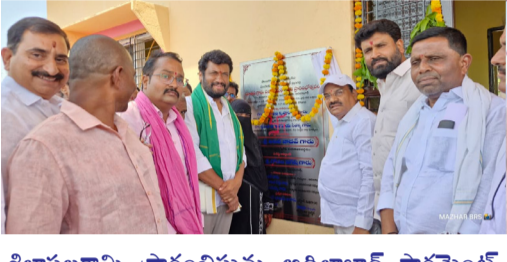
శిలాఫలకాన్ని ప్రారంభిస్తున్న ఆదిలాబాద్ పార్లమెంట్ సభ్యులు నగేష్ ఎమ్మెల్యే అనిల్ జాడవ్ దృశ్యం

ముఖ్య బి గ్రామాన్ని కూడా ఉత్తమ గ్రామ పంచాయతీగా అభివృద్ధి చేద్దాం ఖబరస్తాన్ కొరకు కాంపౌండ్ వాల్ మంజూరు చేస్తా