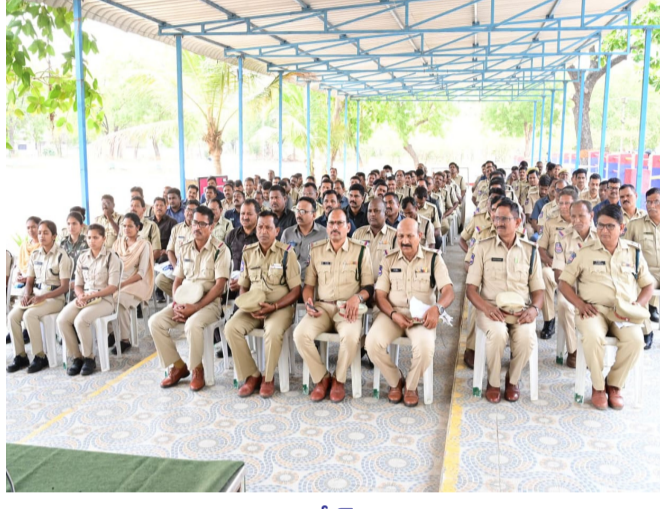
హాజరైన పోలీస్ అధికారులు