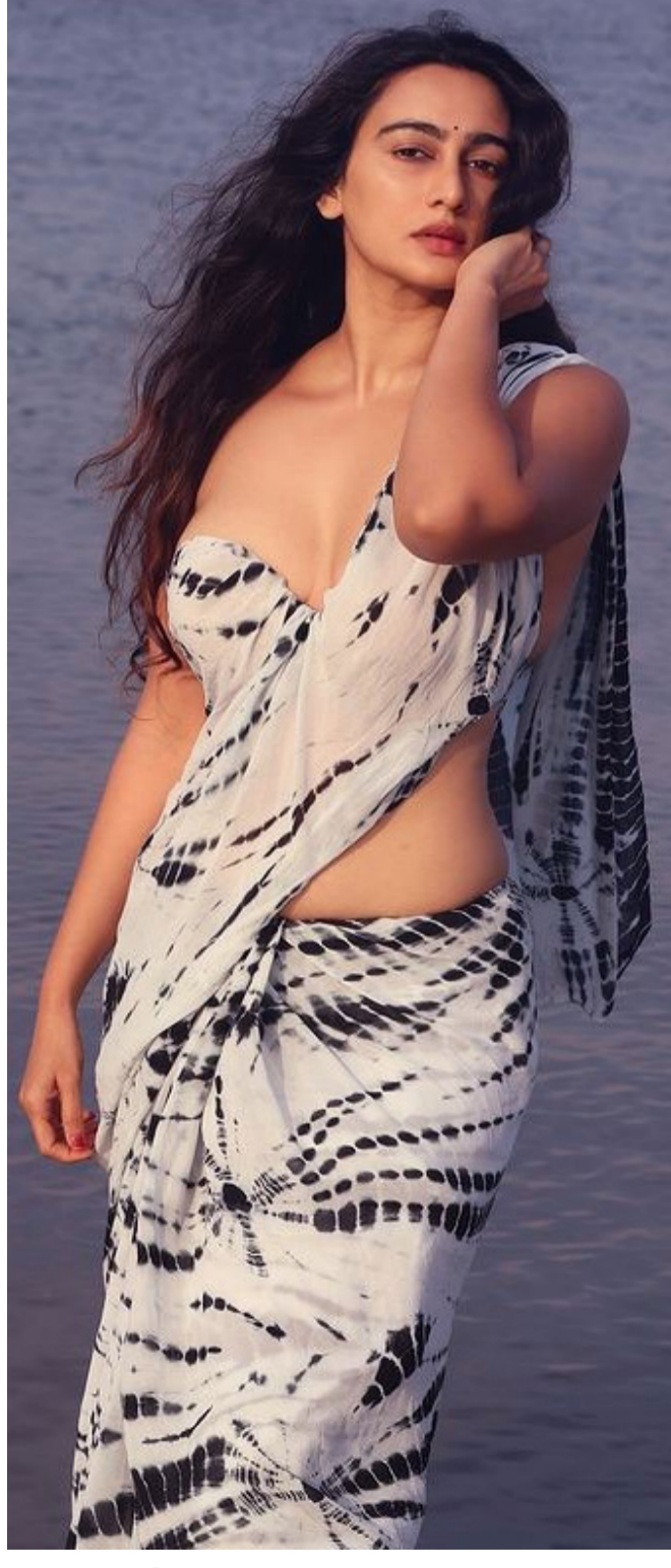
మేఘా హాట్ ఇన్ శారీ