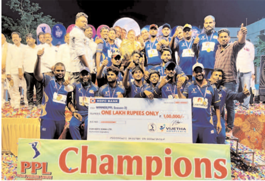
జిమ్ ఏర్పాటు, ఆధునిక ఐమాక్స్ లైట్స్ ఏర్పాటు వంటి పలు మరింత రాణించేందుకు అవసరమైన అన్ని సౌకర్యాలు అభివృద్ధి పనులు పూర్తి చేసినట్లు పేర్కొన్నారు. యువత క్రీడల్లో కల్పించడమే తమ లక్ష్యమని ఎమ్మెల్యే తెలిపారు.