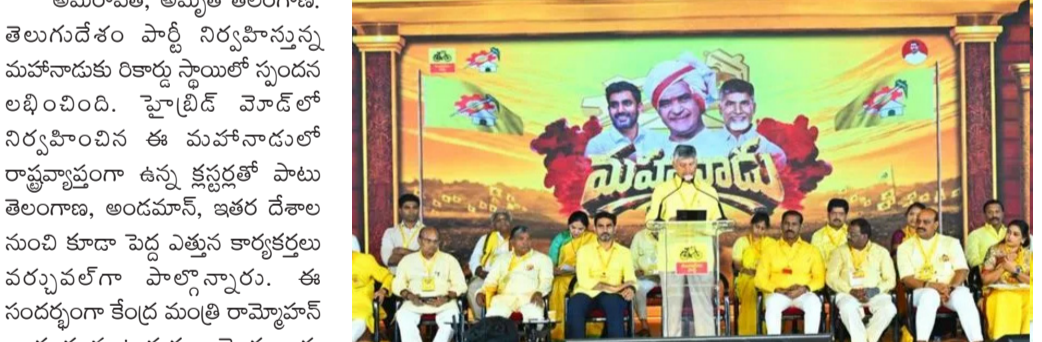
చేసుకున్నారని తెలిపారు. రామోహన్ నాయుడు ఈ ప్రకటన చేయగానే మహానాడులో పాల్గొన్న నేతలు, కార్యకర్తలు హర్షధ్వనిలు చేశారు. ఒక ప్రాంతీయ పార్టీ హైద్రాబాద్ మోడల్ మహానాడు నిర్వహించడం, లక్షలాది మంది వర్చువల్ గా పాల్గొనడం రికార్డు అని రామోహన్ నాయుడు పేర్కొన్నారు.

అమరావతి, అమ్మత్ తెలంగాణ: తెలుగుదేశం పార్టీ నిర్వహిస్తున్న మహానాడు రికార్డు స్థాయిలో స్పందన లభించింది. హైద్రాబాద్ మోడల్ లో నిర్వహించిన ఈ మహానాడులో రాష్ట్రవ్యాప్తంగా ఉన్న క్లస్టర్లతో పాటు తెలంగాణ, అందమన్, ఇతర దేశాల నుంచి కూడా పెద్ద ఎత్తున కార్యకర్తలు వచ్చువల్గా పాల్గొన్నారు. ఈ సందర్భంగా కేంద్ర మంత్రి రామోహన్ నాయుడు మాట్లాడుతూ.. మొత్తం ఆరు లక్షల మంది కార్యకర్తలు మహానాడులో పాల్గొన్నట్లు వెల్లడించారు. రాష్ట్రంలోని 1875 క్లస్టర్ల ద్వారా కార్యకర్తలు తమ ఐడీ కార్డులతో హాజరు నమోదు