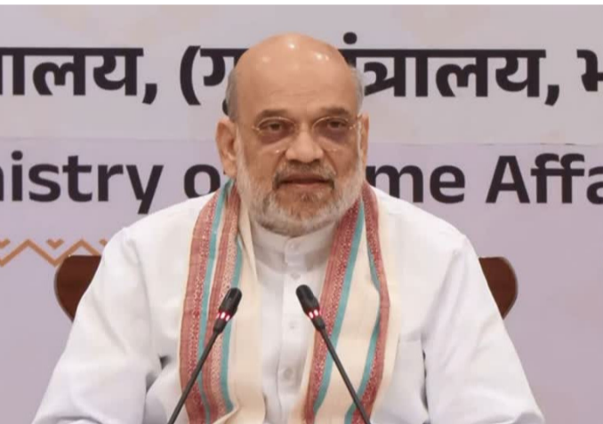
అందేరా చూడాలని అమిత్ షా ఆదేశించారు. అలాగే సైబర్ నేరాలను ఎదుర్కోవడానికి '1930' కాలే సెంటర్ను సమర్థవంతంగా ఉపయోగించుకోవాలని పిలుపునిచ్చారు. ఈ అంశాలపై రెండు నెలల తర్వాత తిరిగి సమీక్ష, అభిప్రాయ సేకరణ చేపడుతారని తెలిపారు. అంతేకాకుండా జిల్లాలు ఫలిత ఆధారిత చర్యలను నిర్ధారించుకోవాల్సి ఉంటుందని పేర్కొన్నారు.

రాజస్థాన్, అమ్మత్ తెలంగాణ: దేశ సరిహద్దులకు 15 కిలోమీటర్ల పరిధిలో ఉన్న అక్రమ నిర్మాణాలన్నీ కూల్చివేయాలని కేంద్ర హోంమంత్రి అమిత్ షా ఆదేశించారు. ఈ ఆంశంలో రాజీలేని విధానాన్ని అమలు చేయాలన్నారు. రాజస్థాన్లోని భారత్-పాక్ సరిహద్దు జిల్లాల్లో భద్రతా పరిస్థితులపై అమిత్ షా ఉన్నతస్థాయి సమావేశం నిర్వహించారు. దీనికి రాజస్థాన్ సీఎం భజన్ లాల్ శర్మతో పాటు పలువురు ఉన్నతాధికారులు హాజరయ్యారు. సరిహద్దు ప్రాంతాల్లో అక్రమాలకు అడ్డుకట్ట వేసేందుకు ఆయా జిల్లా కలెక్టర్లకు అదనపు బాధ్యతలను అప్పగిస్తూ కేంద్ర హోంశాఖ ఆదేశాలు జారీ చేసింది.