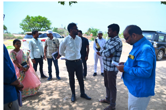
జగిత్యాల అమృత్ తెలంగాణ మే 27: జగిత్యాల జిల్లా ఇబ్రహీంపట్నం మండలం వర్షకాండ, మెట్పల్లి మండలం రామలచ్చకృపేట గ్రామాల్లోని ధాన్యం