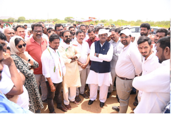
గ్రామంలో గల పరి ధాన్యం కొనుగోలు

అమృత్ తెలంగాణ మంచెలపై జిల్లా న్యూస్ మే 27, 2026: ప్రభుత్వం రైతు సంక్షేమంలో భాగంగా కొనుగోలు కేంద్రాలు ఏర్పాటు చేసి రైతులకు ఎలాంటి ఇబ్బందులు కలగకుండా ధాన్యం కొనుగోలు ప్రక్రియ చేపట్టిందని రాష్ట్ర కార్మిక, ఉపాధి శిక్షణ, కర్మాగార, గనులు, భూగర్భ శాఖ మంత్రి గడ్డం వివేకానంద అన్నారు. బుధవారం జిల్లాలోని జైపూర్ మండలం టేకుమట్ల