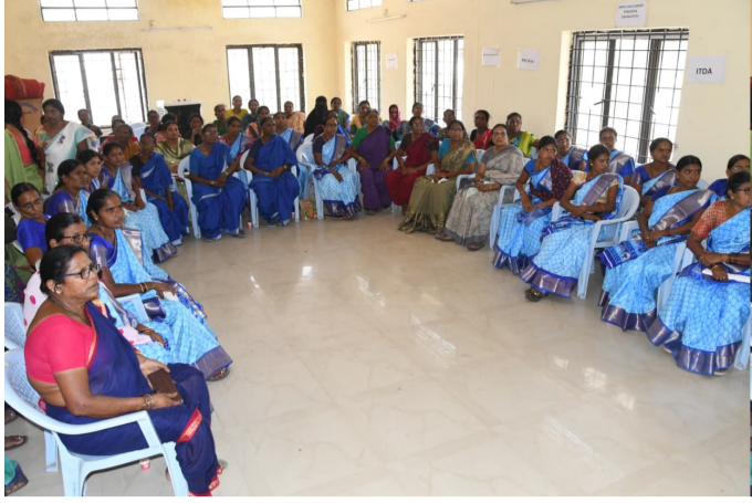
హాజరైన మహిళా సంఘాలు నాయకులు