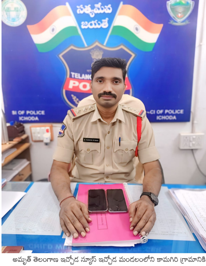
అమృత తెలంగాణ ఇచ్చోడ స్టాన్ ఇచ్చోడ మండలంలోని కామగిరి గ్రామానికి