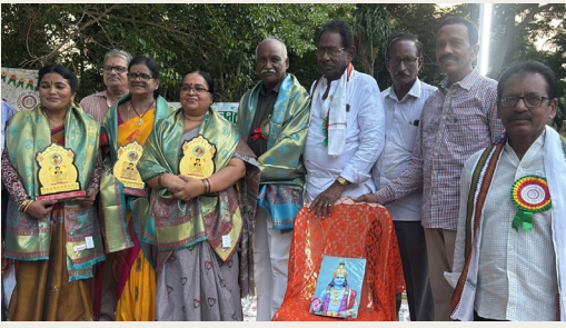
కాకినాడ (మనసులో మాట) మే 28