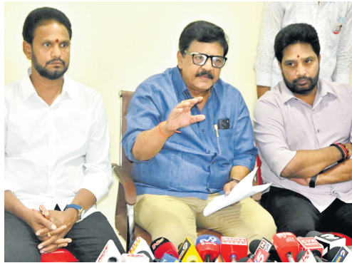
-రాజమహేంద్రవరం (మనసులో మాట ప్రత్యేక ప్రతినిధి), మే 28: