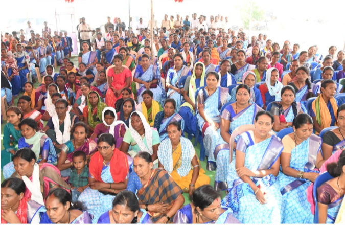
సమావేశానికి హాజరైన ప్రజలు