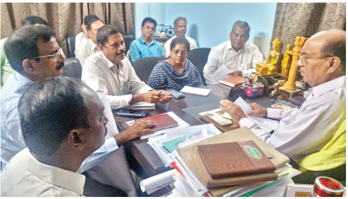
రాజమహేంద్రవరం (మనసులో మాట ప్రత్యేక ప్రతినిధి), మే 29:

పెండింగ్ పనులను త్వరగా పూర్తి చేయాలని, అభివృద్ధి పనుల్లో వేగం పెంచాలని రాజమహేంద్రవరం రూరల్ ఎమ్మెల్యే గోరంట్ల బుచ్చయ్య చౌదరి అన్నారు. శుక్రవారం గోరంట్ల కార్యాలయంలో మున్సిపల్, పంచాయతీరాజ్, ఆర్డబ్ల్యూఎస్, పలు శాఖల అధికారులతో రాజీయే పుష్కరాల పనులపై ఎమ్మెల్యే సమీక్షా సమావేశం నిర్వహించారు. ఆ సందర్భంగా ఎమ్మెల్యే గోరంట్ల మాట్లాడుతూ ..మిగతా 2లో