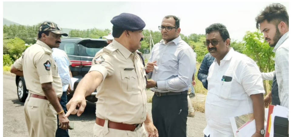
కాకినాడ (మనసులో మాట), మే 29: