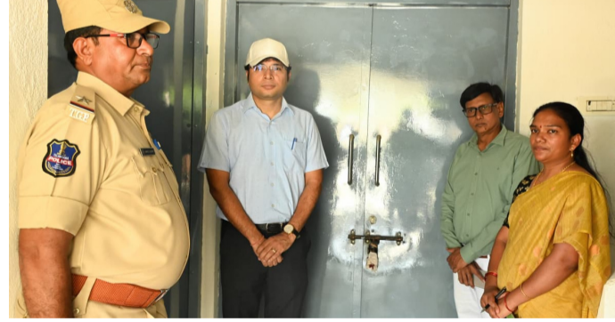
నిర్మల్ జిల్లా మే 30 అమృత్ తెలంగాణ నిర్మల్ కలెక్టరేట్ సమీపంలో గల ఈవీఎం గోదాం కేంద్రాన్ని సాధారణ తనిఖీల్లో భాగంగా శనివారం జిల్లా కలెక్టర్ భవేష్ మిశ్రా తనిఖీ చేశారు. ఈ సందర్భంగా అన్ని రిజిస్టర్లను తనిఖీ చేశారు. సీసీ కెమెరాల పనితీరు పరిశీలించారు. పోలీసు సిబ్బంది నిరంతరం సీసీ కెమెరాలు పర్యవేక్షణతో మెరుగైన భద్రతను నిర్వహించాలని తెలిపారు. సిబ్బంది పటిష్ట