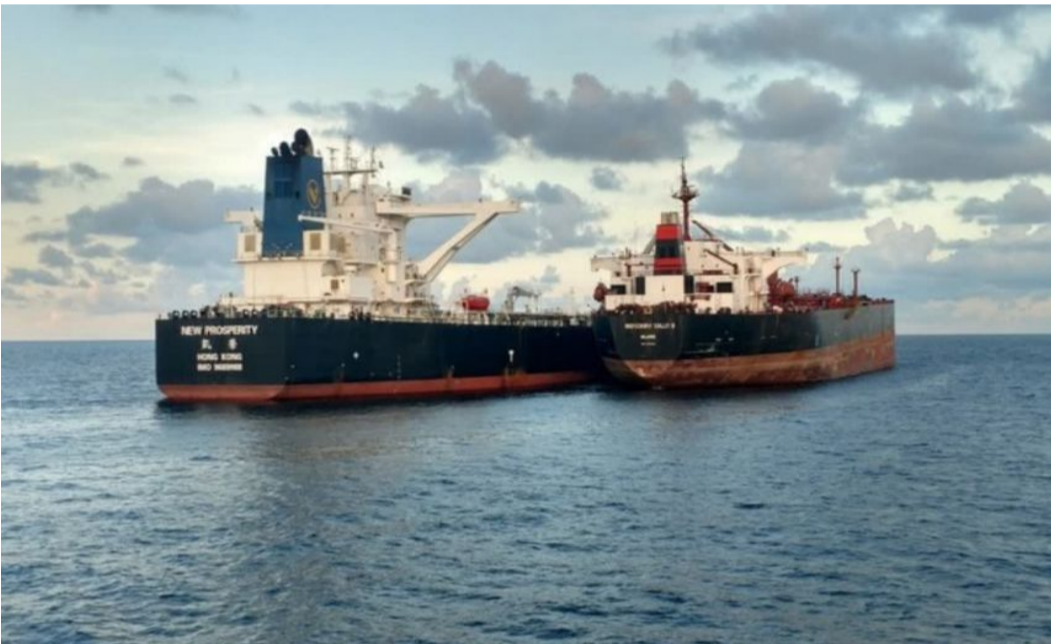
అమెరికా నుంచి మరీ ఇలా ఏంటి

మళ్లీ రష్యానే టాప్ అమెరికా నుంచి భారీగా తగ్గిన కొనుగోళ్లు రష్యా, యూపిఈ నుంచి చమురు దిగుమతుల్ని భారీగా పెంచిన భారత్ ఇప్పటికే అతిపెద్ద సరఫరాదారుగా రష్యానే- యూపిఈ నుంచి కూడా లికార్డు స్థాయిలో పెరిగిన చమురు కొనుగోళ్లు