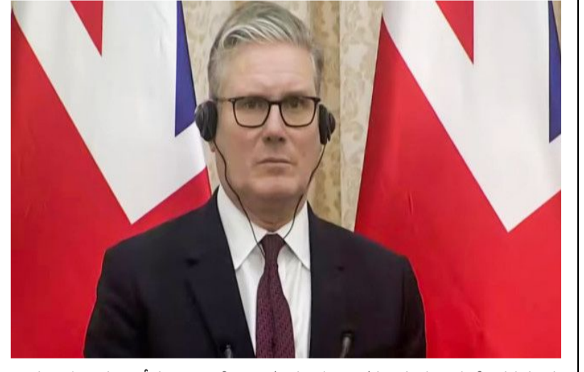
భావిస్తున్నారు. ప్రజా సేవలపై ఒత్తిడి, ఆర్థిక సవాళ్ళు, ఆక్రమ వలసల వంటి సమస్యలను పరిష్కరించడంలో ప్రభుత్వాలు విఫలమవుతున్నాయనే విమర్శలు బ్రిటన్ లో పెరుగుతున్నాయి.