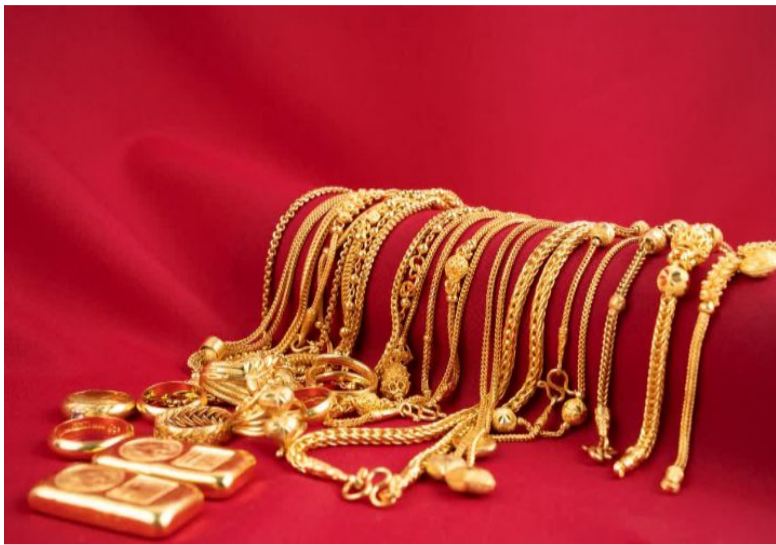
వల్ల దీనితో నేరుగా ఆభరణాలను తయారు చేయలేరు. అందుకే దీనిని బంగారు నాణేలు, విస్తృతమైన మరియు బాధ్య రూపంలో పెట్టుబడులు కోసం ఉపయోగిస్తారు.

916 హోల్మార్క్ ప్రాధాన్యం : హోల్మార్క్ అనేది బంగారం స్వచ్ఛతకు ప్రభుత్వ పరంగా లభించే అధికారిక గ్యారంటీ. 22 క్యారెట్ల గుర్తు: మార్కెట్లో '916 హోల్మార్క్' ఉన్న బంగారాన్ని 22 క్యారెట్ల నాణ్యమైన ఆభరణంగా గుర్తిస్తారు. భవిష్యత్తు ప్రయోజనం : హోల్మార్క్ నగలను కొనుగోలు చేయడం వల్ల మోసపోయే అవకాశం ఉండదు. అలాగే, భవిష్యత్తులో వాటిని తిరిగి విక్రయించినప్పుడు కూడా మంచి రేసేట్ విలువ లభిస్తుంది. బంగారం స్వచ్ఛతను ఎలా లెక్కిస్తారు: బంగారం నాణ్యతను క్యారెట్లలో కొలుస్తారు. క్యారెట్ విలువ పెరిగేకొద్దీ స్వచ్ఛత పెరుగుతుంది. 24 క్యారెట్ల బంగారం : ఇది 99.9% అత్యంత స్వచ్ఛమైన బంగారం. అయితే, ఇది చాలా మెత్తగా ఉండటం