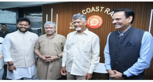
చేసింది. శాశా ఉత్తర్వులతో రాయగడ డివిజన్ లో ఇంతకు ముందున్న పలానా-ఇచ్చాపురం రైల్వే లైన్, ఇచ్చాపురం-చువ్వూరు-విజయనగరం లైన్ ను విశాఖ డివిజన్ లో చేరాయి. అదే విధంగా నౌపద -వర్ధాకిమిడి, బొద్దిలి-సాలూరు లైన్ లు సింహాచలం-వడ్లపాడి, విశాఖ-జగ్గయ్యపాలెం రైల్వేలైన్లను విశాఖ డివిజన్ లో విలీనం చేశారు. కోరాపూట్-కిరండ్ లో లైన్ ను విశాఖ, రాయగడ డివిజన్లకు సంయుక్తంగా కేటాయించింది. ఈ మార్పుల్ని జూన్ 1, 2026 నుంచి అమల్లోకి వచ్చేయని నోటిఫికేషన్ లో రైల్వే బోర్డు స్పష్టం చేసింది. ఇవే గీటురాళ్లు: ఉత్తరాంధ్ర అభివృద్ధికి విశాఖ రైల్వే జోన్

రాష్ట్ర ప్రజల చిరకాల స్వప్నం నెరవేరిందన్నారు. ఏపీ విజ్ఞప్తిని మన్నించి చరిత్రాత్మక గజిల్ విడుదలకు సహకరించిన ప్రధాని మోదీ, రైల్వే శాఖ మంత్రి అశ్వినీ వైష్ణవ్ కు ధన్యవాదాలు తెలిపారు. ఈ ఏడాది జూన్ 1 నుంచి జూన్ అధికారిక కార్యకలాపాలు ప్రారంభం అవుతాయన్నారు. ఉత్తరాంధ్ర పారిశ్రామిక వృద్ధికి దోహదం: వాల్తేరు డివిజన్ పునర్వ్యవస్థీకరణలో భాగంగా పలానా-ఇచ్చాపురం వంటి కీలక స్వక్షేపన విశాఖ డివిజన్ లో విలీనం చేయడం ఉత్తరాంధ్ర రవాణా రంగ ముఖ్యలక్ష్యాన్ని మారుస్తుందని అభిప్రాయపడ్డారు. సూతనంగా ఏర్పాటైన విశాఖ డివిజన్, రాయగడ డివిజన్ల మధ్య సమన్వయంతో రైల్వే వ్యవస్థ మరింత బలోపేతమవుతుందని వెల్లడించారు. రాష్ట్ర అభివృద్ధికి, ప్రత్యేకించి ఉత్తరాంధ్ర పారిశ్రామిక వృద్ధికి ఈ జోన్ దోహదపడుతుందని చంద్రబాబు ఆశాభావం వ్యక్తం చేశారు. విశాఖ డివిజన్ లో విలీనం: గుంతకల్లు డివిజన్ నుంచి “రాయచూర్ - వాడి నెక్స్ట్” సికింద్రాబాద్ డివిజన్ కు బదిలీ అయింది. రాయగడ నుంచి కాన్పి నెక్స్ట్ ను విశాఖ డివిజన్ లో కలుపుతూ ఉత్తర్వులు విడుదల చేసింది. శాశా ఉత్తర్వులతో రాయగడ డివిజన్ లో ఇంతకు ముందున్న పలానా-ఇచ్చాపురం రైల్వే లైన్, ఇచ్చాపురం-చువ్వూరు-విజయనగరం లైన్ ను విశాఖ డివిజన్ లో చేరాయి. అదే విధంగా నౌపద -వర్ధాకిమిడి, బొద్దిలి-సాలూరు లైన్ లు సింహాచలం-వడ్లపాడి, విశాఖ-జగ్గయ్యపాలెం రైల్వేలైన్లను విశాఖ డివిజన్ లో విలీనం చేశారు. కోరాపూట్-కిరండ్ లో లైన్ ను విశాఖ, రాయగడ డివిజన్లకు సంయుక్తంగా కేటాయించింది. ఈ మార్పుల్ని జూన్ 1, 2026 నుంచి అమల్లోకి వచ్చేయని నోటిఫికేషన్ లో రైల్వే బోర్డు స్పష్టం చేసింది. ఇవే గీటురాళ్లు: ఉత్తరాంధ్ర అభివృద్ధికి విశాఖ రైల్వే జోన్