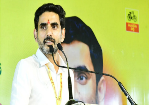
భారతదేశాన్ని ప్రపంచ బీజ్ హబ్ గా నిలబెట్టాలని లక్ష్యంగా పెట్టుకుంది. ఈ వ్యూహంలో భాగంగా ఇప్పటికే శ్రీనీటి ఏపీ, కూలింగ్ తయారీ రంగంలో రూ.12,000 కోట్ల పెట్టుబడులను ఆకర్షించింది.

ప్రపంచ స్థాయి పారిశ్రామిక ప్రాంతాలు, బలమైన విద్యావల మద్దతుతో ఈ లక్ష్యాన్ని సాధిస్తామని ఆయన ధీమా వ్యక్తం చేశారు. అంధ్రప్రదేశ్ ఇప్పటికే డేటా సెంటర్ ఏర్పాటులో దేశంలోనే కీలక గమ్యాన్ని సాధించిన విద్యార్థులను పట్టణ వర్గాలు తెలిపాయి. ఇటీవల విశాఖపట్టణంలో 15 టెలియన్ డ్రాఫ్ట్ పెట్టుబడితో గూగుల్ ఏపీ డేటా సెంటర్ హాల్ తో శంకుస్థాపన జరిగింది. దీనికి తోడు, రిలయన్స్ ఇండస్ట్రీస్ నుంచి రూ.1.6 లక్షల కోట్ల పెట్టుబడి ప్రతిపాదనలు కూడా ఉన్నాయి. మొత్తంగా సుమారు రూ.6 లక్షల కోట్ల పెట్టుబడుల పైవైవేలో రాష్ట్రం ముందుకు సాగుతుంది. డేటా సెంటర్లకు మౌలిక సదుపాయాల నుంచి వాటికి అవసరమైన కూలింగ్ సిస్టమ్స్, పవర్ మేనేజిమెంట్ సెల్యూలర్స్, ఎలక్ట్రానిక్స్ వంటి భాగాల తయారీ వరకు పూర్తిస్థాయి వ్యవస్థలను రాష్ట్రంలో నిర్మించడంపై ప్రభుత్వం దృష్టి సారించింది. తన ద్వారా దిగుమతులను ఆధారపడకుండా సాధించి, ఎగుమతులను ప్రోత్సహించడంతో పాటు, డేటా ఇన్ఫ్రాస్ట్రక్చర్ తయారీలో