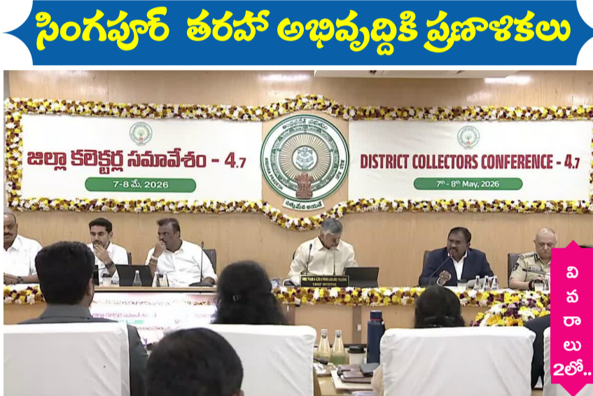
మంత్రి పయ్యప్పల కేశవ్ వివరించారు. ప్రజలకు ఏం మేలు జరుగుతుందోనే అంశాన్ని ఆలోచించి ప్రతి పైసా ఖర్చు చేస్తున్నామన్నారు. ప్రజలకు మెరుగైన జీవితం కల్పించేలా ప్రాధాన్యతలను మార్చుకుంటూ వెళ్తున్నామన్నారు. వ్యవస్థలో లోపాలను సవరించుకుంటూ ఆదాయాలను పెంచుకోవాలని

ఆంధ్రప్రదేశ్ లో ఉన్న బలమైన వ్యవస్థలైన ఆర్టిజిఎస్, మీ భూమి, సింగిల్ డెస్క్ వంటి వాటిని సింగపూర్ మాదిరి ఒకదానితో ఒకటి అనుసంధానించాలన్న మంత్రాలు అమరావతి: సీఎం చంద్రబాబు అధ్యక్షతన సచివాలయంలో కలెక్టర్ల సదస్సు నిర్వహించారు. ఈ క్రమంలో సింగపూర్ వెళ్లొచ్చిన మంత్రులు తమ అభిప్రాయాలను పంచుకున్నారు. సింగపూర్ తరహాలో రాష్ట్రాన్ని అభివృద్ధి చేసేందుకు వలు నలహాలు ఇవ్వాలి. ఆర్థికవ్యవస్థను సవాళ్లను అధిగమిస్తూ ఏపీ ముందుకు వెళ్లేందుని కలెక్టర్ల కాన్ఫరెన్స్‌లో ఆర్థిక