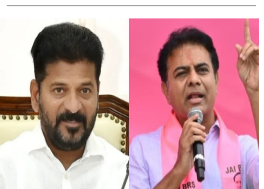
బతికిన సాగు రంగాన్ని, కాంగ్రెస్ ప్రభుత్వం అధికారంలోకి వచ్చిన కేవలం కొద్ది నెలల్లోనే కనిపిస్తే సేస్తూగా మార్చేసిందని ఆయన

ఆరోపించారు. రాష్ట్రవ్యాప్తంగా పంట అమ్మకావడానికి వచ్చిన రైతులు కొనుగోలు కేంద్రాల వద్దే వారాల తరబడి వడిగావులు కాస్తూ, గుండెపగిలి కుప్పకూలుతున్నా ప్రభుత్వానికి కనీస సోయి లేదని కేబీఆర్ విమర్శించారు. ముఖ్యమంత్రి తన కుర్చీని కాపాడుకోవడానికి 70 సార్లు ఢిల్లీ చుట్టూ తిరగడంపై ఉన్న శ్రద్ధలో ఒక్క శాతం కూడా రైతులపై పెట్టడం లేదని ఎద్దేవా చేశారు. ఇప్పటికే కామగోలు కేంద్రాల వద్ద ఎండ తీవ్రతకు, పడదెబ్బకు తోడు ప్రభుత్వం చేస్తున్న అలస్యం వల్ల దాదాపు 10 మంది రైతులు ప్రాణాలు కోల్పోయారని లేఖలో పేర్కొన్నారు. వరంగల్ నుంచి ఖమ్మం దాకా ఎక్కడ చూసినా రోజులకు కనీసం ఒక్క లాలో లోడే కూడా వెళ్లడం లేదని, అడపాదడపా కొనే చోట కూడా క్వింటాలుకు 10 కిలోల వరకు తరుగు తీస్తూ రైతుల కడపు కొనుగోలునని ఆవేదన వ్యక్తం చేశారు. చివరికి గన్నీ బ్యాగుల కోసం రైతుల నుంచే రూ. 50 డిజిటల్ పనులు చేసే దుస్థితి తేవడం నిర్ణీతమన్నారు. బీఆర్ఎస్ ప్రభుత్వ హయాంలో కేసీఆర్ మూడు నిలల ముందే ప్రణాళికలు చేసి, కరోనా కక్షకాలంలోనూ రైతుల కల్లాల వద్దకే వెళ్లి చివరి గింజ వరకు కొనుగోలు చేసేలా భరోసా ఇచ్చారని కేబీఆర్