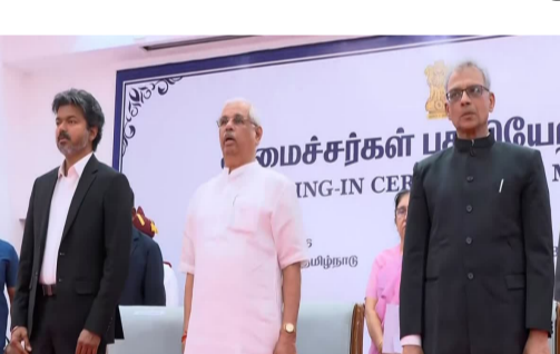
అధ్యక్షులు, నాయకులు నిరంతరం డిమాండ్ చేస్తూ వచ్చారని గుర్తు చేసుకున్నారు.