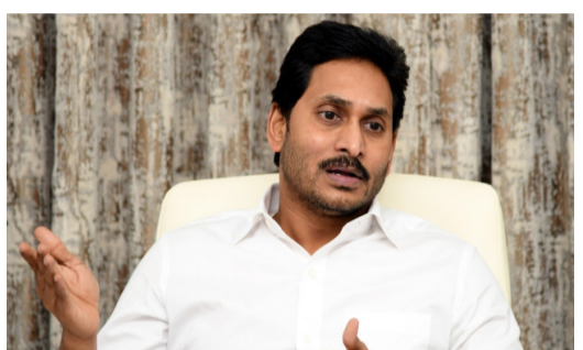
నిలదీశారు. పొరుగు రాష్ట్రమైన తెలంగాణలో కేసీఆర్ కేవలం రూ. 615 కోట్లతోనే అత్యంత ఆధునిక సచివాలయాన్ని నిర్మించారు, కానీ ఏపీలో మాత్రం కొత్త బెండర్ల పేరుతో పాత కాంట్రాక్టర్లకే వసూలు ఇస్తూ ప్రజాధనాన్ని దోచుకుంటున్నారని ఆరోపించారు.

తున్నారని ఆరోపించారు. ఇప్పటికే అమరావతి పేరుతో రూ. 47,387 కోట్లు అప్పు చేశారని, ఖజానా నుంచి మరో రూ. 9,200 కోట్లు ఖర్చు చేస్తూ రాష్ట్ర ప్రజల వెన్ను విరుస్తున్నారని మండిపడ్డారు. అమరావతిలో ఇప్పటికే రూ. 1,200 కోట్ల నిర్మించిన అనిబ్లీ, హైకోర్టు, సెక్రటేరియట్ తాత్కాలిక భవనాలు ఉన్నప్పటికీ, మల్టీ కొత్తగా కడతామనడం విన్నవిపిడి దోచివీడి నిద్రపనున్నారు. కొత్తగా నిర్మించ తలపెట్టిన 5 బిల్డింగ్ల అంచనాలను జగన్ ప్రత్యేకంగా, ఈ ఐదు బిల్డింగుల డిజైన్లకే రూ. 401 కోట్లు తగలలేకారని, మొత్తం నిర్మాణ ఖర్చు రూ. 10,665 కోట్లుగా చూపించారని లెక్కలు కట్టారు. “ప్రస్తుత అంచనాల ప్రకారం చదరపు అడుగుకు నిర్మాణ వ్యయం రూ. 20,427 అవుతోంది. దీనికి ఫర్నిచర్, ఇంటీరియర్ ఖర్చులు కూడా కలిపితే చదరపు అడుగుకు రూ. 30 వేలు కావాలి. ఫైన్ షాఫర్ హోటళ్ల నిర్మాణానికే చదరపు అడుగుకు రూ. 4,500 లోపు ఖర్చవుతుంటే, ఇక్కడ ఇంత భారీ ఖర్చు చేసేది?” అని జగన్