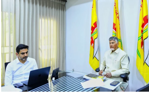
ప్రజల్లోకి తీసుకెళ్లాలని ఆదేశించారు. ఈ మహానాడులో విభిన్న ప్రాంతాల సమన్వయ, రాజకీయ ముఖ్యచింత్రంపై సుదీర్ఘంగా చర్చించనున్నారు. ఇందులో భాగంగా ఆంధ్రప్రదేశ్‌కు సంబంధించి 10, తెలంగాణకు సంబంధించి 4, అందమనాడు చెందిన 1 అంశంతో పాటు ఉమ్మడి అంశాలపై మరో 4 తీర్మానాలను ప్రవేశపెట్టనున్నారు. వీటికి తోడు రెండు రాష్ట్రాల్లోని తాజా రాజకీయ పరిస్థితులు, సవాళ్లపై

మహానాడు నిర్వహణను కేవలం ఒకే ప్రాంతానికి పరిమితం చేయకుండా గ్రామాలలోని క్షుద్ధర స్థాయిలోనే నిర్వహించాలని పాలిట్ బ్యూరో భారూ చేసింది. అన్ని క్షుద్ధరలో తెలుగువారి ఆరాధ్యదేవం, నందమూరి తారకరామారావు చిగ్రహాలకు ఘనంగా నివాళులర్పించి కార్యక్రమాలను ప్రారంభిస్తారు. మహానాడుకు రెండు రోజుల ముందు నుంచే పండుగ వాతావరణం ప్రతిబింబించేలా రాష్ట్రవ్యాప్తంగా ప్రతి కార్యకర్త, అభిమాని ఇంటిపై డిటీడీ జెండాను రెవలవలాడించాలని చంద్రబాబు విలుపునిచ్చారు. మొత్తం 19 తీర్మానాలకు ఆమోదం : పార్టీ భవిష్యత్తు కార్యవరణను నిర్దేశించేలా పాలిట్ బ్యూరో సమావేశంలో మొత్తం 19 తీర్మానాలకు ఆమోదం తెలిపారు. వీటిలో పాటు మహానాడులో చర్యలకు రానున్న వివిధ అంశాలపై చంద్రబాబు పలు కీలక సూచనలు చేశారు. ప్రసంగంలో ప్రతి వక్తా తమకు తేటాయించిన అంశంపై పూర్తి నిష్పాతరై ఉండాలని, ఎలాంటి సాగతీత లేకుండా, సమయపాటన పాటిస్తూ విషయాన్ని సూటిగా, స్పష్టంగా