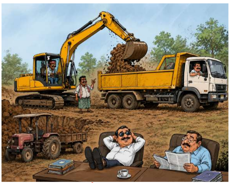
అధికారుల మౌనంపై ప్రజల్లో బహిరంగ చర్యలు

విజేత, సత్తుపల్లి : సత్తుపల్లి మండలంలో అక్రమ మట్టి తవ్వకాల వ్యవహారం రోజురోజుకు మరింత విస్తరిస్తూ ప్రజల్లో తీవ్ర ఆందోళనకు గురి చేస్తోంది. అనుమతులు లేకుండా, లేదా అరకొర అనుమతులతోనే చెరువులు, ప్రభుత్వ భూములు, వ్యవసాయ భూముల్లో యధేచ్ఛగా మట్టి తవ్వకాలు జరుగుతున్నాయనే ఆరోపణలు వెల్లువెత్తుతున్నాయి. రాత్రింబ వళ్ల జేసేబీలు, టిప్పర్లు, ట్రాక్టర్లతో మట్టిని తరలిస్తూ కోట్ల రూపాయల అక్రమ వ్యాపారం సాగుతున్నప్పటికీ సంబంధిత శాఖల అధికారులు మాత్రం నిమ్మకు నీరెత్తినట్లు వ్యవహరిస్తున్నారనే విమర్శలు బలంగా వినిపిస్తున్నాయి.