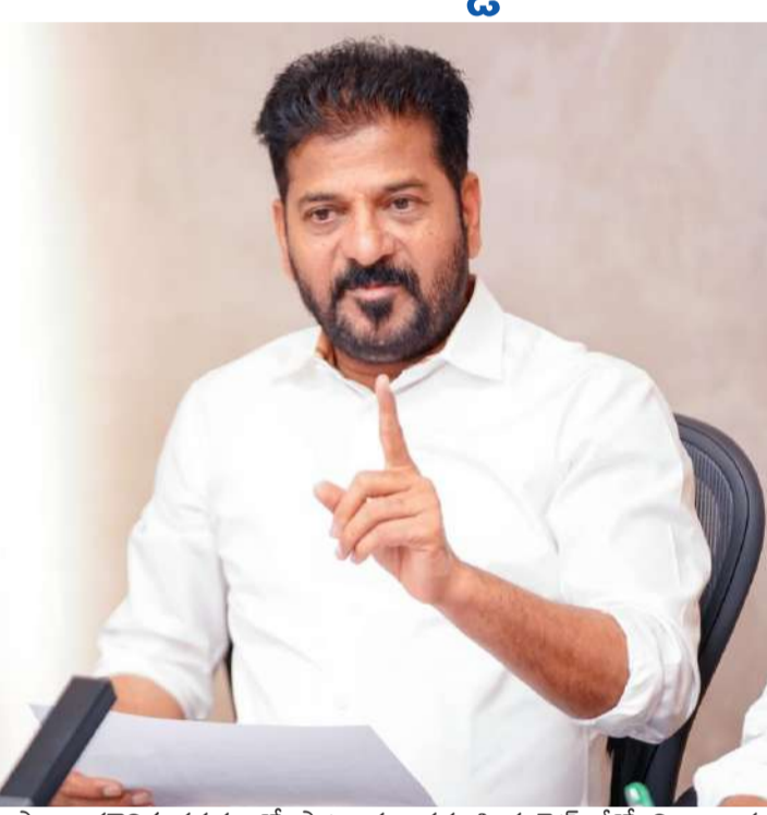
స్థాయి మౌలిక వసతులతో పాటు పర్యావరణహిత నెట్-జీరో విధానాలను తప్పనిసరిగా అమలు చేయాలని ముఖ్యమంత్రి ఆదేశించారు.

విశేష, హైదరాబాద్, మే 20 : తెలంగాణలో గ్లోబల్ కేవలీబిటీ సెంటర్ల (+జిజి) ఏర్పాటుకు అంతర్జాతీయ సంస్థల నుంచి పెరుగుతున్న ఆసక్తిని దృష్టిలో ఉంచుకుని, ఐటీ రంగాన్ని కేవలం హైదరాబాద్ మహానగరానికే పరిమితం చేయకుండా జిల్లాలకు కూడా విస్తరించాలని ముఖ్యమంత్రి ఎ. రేవంత్ రెడ్డి స్పష్టం చేశారు. ఐటీ, పరిశ్రమల శాఖల అంశాలపై మంత్రి దుద్దిక్ష శ్రీధర్ బాబుతో కలిసి ఎంసీఆర్ హెచ్ఆర్డీలో నిర్వహించిన ఉన్నత స్థాయి సమీక్షలో ముఖ్యమంత్రి పలు కీలక ఆదేశాలు జారీ చేశారు.