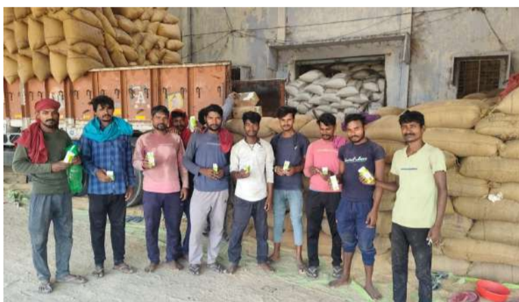
ఎక్కడా ఎలాంటి ఇబ్బందులు లేకుండా కొనుగోలు ప్రక్రియ కొనసాగుతోందని కలెక్టర్ స్పష్టం చేశారు.