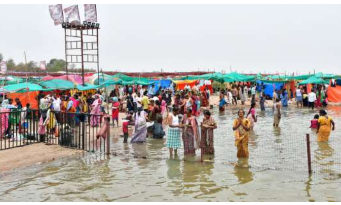
ప్రవచనాలు అందించడంతో భక్తుల రాక మరింతగా పెరుగుతోంది. ఎండ తీవ్రతను దృష్టిలో ఉంచుకుని మంచినీటి సరఫరా, చలువ పందిళ్లు, మిస్ ఫాగ్ స్ప్రింకర్లు ద్వారా నీటి జల్లులు పడేలా ప్రత్యేక ఏర్పాటు చేయడం ద్వారా భక్తులు సేదతీరుతున్నారు. భక్తులకు ఎలాంటి అసౌకర్యం కలగకుండా అన్ని శాఖల సమన్వయంతో యంత్రాంగం విస్తృత ఏర్పాటు చేసి పుష్కరాలను విజయవంతంగా నిర్వహిస్తోంది.

విజేత, జయశంకర్ భూ పాలపల్లి : సరస్వతీ అంత్య పుష్కరాల సందర్భంగా మూడవ రోజు కాళేశ్వరం త్రివేణి సంగమంలో భక్తుల రద్దీ క్రమంగా పెరుగుతోంది. మండుతున్న ఎండను సైతం లెక్కచేయకుండా భక్తులు భారీ సంఖ్యలో తరలి వచ్చి పుణ్యస్నానాలు ఆచరిస్తూ స్వామివారిని దర్శించుకుంటున్నారు. ఆర్టీసీ బస్సుల్లో వచ్చే భక్తుల సౌకర్యార్థం బస్టాండ్ నుండి పుష్కర ఘాట్ వరకు ఉచిత షటిల్ సర్వీసులు ఏర్పాటు చేయడంతో భక్తులు సులభంగా ఘాట్లకు చేరుకుంటున్నారు. త్రివేణి సంగమంలో పుణ్యస్నానాలు ఆచరించిన అనంతరం భక్తులు కాళేశ్వరం ప్రధాన ఆలయాన్ని సందర్శించి శ్రీ కాళేశ్వర ముక్తేశ్వర స్వామివారికి అభిషేకాలు నిర్వహిస్తున్నారు. అలాగే శుభానంద దేవి, సరస్వతి మాతలను దర్శించుకుంటున్నారు. ప్రతిరోజూ నిర్వహిస్తున్న స్వామివారి కల్యాణం, ప్రత్యేక హోమాలలో భక్తులు ఉత్సాహంగా పాల్గొంటున్నారు. సరస్వతి ఘాట్ వద్ద సాయంత్రం నిర్వహించే సరస్వతి సవరత్న మాలా హారతి ప్రత్యేక ఆకర్షణగా నిలుస్తోంది. హారతి అనంతరం సాంస్కృతిక కళా ప్రదర్శనలు, పండితుల ప్రవచనాలు భక్తులను ఆకట్టుకుంటున్నాయి. వివిధ ప్రాంతాల నుండి స్వామీజీలు విచ్చేసి