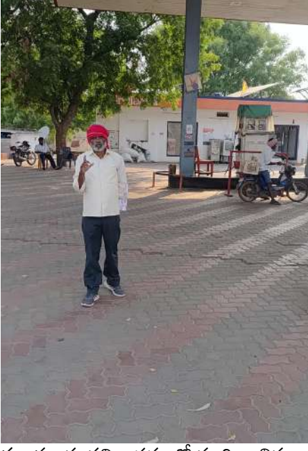
గదారులకు కల్పించడంలో పూర్తిగా విఫలం అయినందున బంకు యజమానిపై చర్యలు తీసుకోవాలని డిమాండ్ చేశారు.