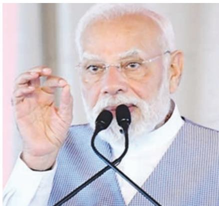
- మిగతా 2లో..

దేశంలో నెలకొన్న ఆర్థిక అనిశ్చితి, సరఫరా గొలుసులో ఏర్పడిన అంతరాయాలను అధిగమించేందుకు ప్రజలు తమ జీవనశైలిని మార్చుకోవాలని ప్రధాని నరేంద్ర మోడీ కోరారు. పశ్చిమాసియా యుద్ధం నేపథ్యంలో ప్రపంచ వ్యాప్తంగా ముడి చమురు ధరలు పెరగడాన్ని ప్రస్తావిస్తూ మోడీ ఈ వ్యాఖ్యలు చేశారు. కేంద్ర ప్రభుత్వ వైఫల్యాలను కప్పిపుచ్చి ప్రధాని ప్రజలపై ఆంక్షలు విధించేందుకు ప్రయత్నిస్తున్నారని ఆదివారం హైదరాబాద్ లోని పరేడ్ గ్రౌండ్ లో జరిగిన బహిరంగ సభలో మోడీ, విదేశీ మారకద్రవ్యాన్ని ఆదా చేసేందుకు ఏడాది పాటు బంగారం కొనుగోళ్లు, విదేశీ ప్రయాణాలకు దూరంగా ఉండాలని పిలుపునిచ్చారు. విదేశీ మారకద్రవ్య నిల్వలపై ఒత్తిడిని తగ్గించేందుకు బంగారం కొనుగోళ్లను నియంత్రించుకోవాలని