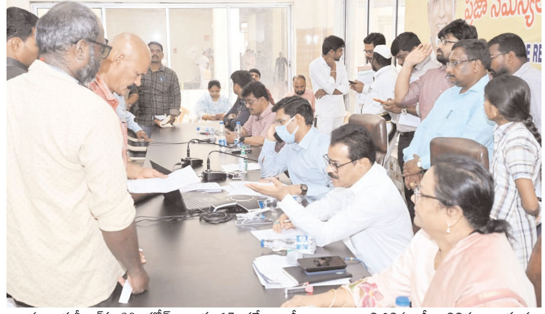
గా, పంచాయతీరాజ్ కు 29, హోమ్ శాఖకు 17, సర్వే అర్జీలు అందాయి. మిగిలిన అర్జీలు వివిధ శాఖలకు సంబంధించినవిగా అధికారులు తెలిపారు.

- అర్జీలపై నిర్ణయం వహిస్తే శాఖాపరమైన చర్యలు తప్పవు - జిల్లా కలెక్టర్ డా.ఎస్. వెంకటేశ్వర్