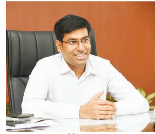
మాన్ని విజయవంతం చేసేందుకు సహకరించాలని జిల్లా కలెక్టర్ విజ్ఞప్తి చేశారు.

తిరుపతి జిల్లాలో కూడా ప్రత్యేక సవరణ కార్యక్రమం షెడ్యూల్ ఖరారైనట్లు వెల్లడించారు. షెడ్యూల్ ప్రకారం జూన్ 5 నుంచి 14 వరకు సన్నాహాలు, శిక్షణ, ముద్రణ కార్యక్రమాలు నిర్వహించనుండగా, జూన్ 15 నుంచి జూలై 14 వరకు బిఎల్ఓల ఇంటింటి పర్యటనలు చేపట్టనున్నారు. జూలై 21న ముసాయిదా ఓటర్ల జాబితా విడుదల చేయనుండగా, జూలై 21 నుంచి ఆగస్టు 20 వరకు దావాలు, అభ్యంతరాలు స్వీకరించనున్నారు. సెప్టెంబర్ 22న తుది ఓటర్ల జాబితా ప్రచురించనున్నట్లు తెలిపారు. రాజకీయ పార్టీలు, ఓటర్లు అందరూ ఎన్ఎస్ఆర్ కార్యక్రమం