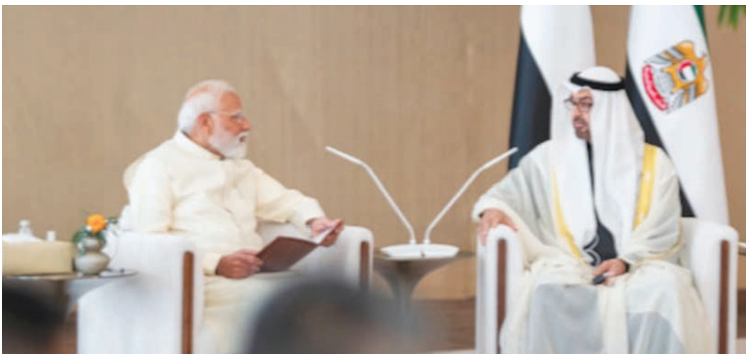
ఖండించారు. "పశ్చిమాసియా యుద్ధం ప్రభావం ప్రపంచం మొత్తంపై ఉంది. అయితే, భారత్ ఎప్పుడూ చర్చలు, సంప్రదింపులకే ప్రాధాన్యమిస్తుంది. చమురు రవాణాకు కీలక మార్గమైన హరూజ్ జలసంధి ఎప్పుడూ తెరిచే ఉండాలి. అదేవిధంగా హరూజ్పై అంతా అంతర్జాతీయ చట్టాలకు

అబుదాబి-ఆంధ్రనాడు, మే 15 ఐదు దేశాలు, ఆరు రోజుల పర్యటనలో భాగంగా యునైటెడ్ అరబ్ ఎమిరేట్స్ (యుఎఇ) చేరుకున్న ప్రధాని మోడీ.. యుఎఇ అధ్యక్షులు నహ్యూన్తో శుక్రవారం ద్వైపాక్షిక చర్చలు జరిపారు. ఇరుదేశాల మధ్య వ్యూహాత్మక భాగస్వామ్యాన్ని ముందుకు తీసుకెళ్లటంతో పాటు పశ్చిమాసియా సంక్షోభంపై అభిప్రాయాలను పంచుకున్నారు. ఎల్పీజి సరఫరా, వ్యూహాత్మక పెట్రోలియం నిల్వల రంగాల్లో సహకారంతోపాటు పలు ఒప్పందాలు చేసుకున్నారు. భారత్లో మౌలిక సదుపాయాల రంగంలో 5 బిలియన్ డాలర్లు పెట్టుబడి పెట్టునున్నట్లు యుఎఇ ప్రకటించింది. అలాగే, వ్యూహాత్మక రక్షణ భాగస్వామ్యం, నౌకల మరమ్మత్తు కేంద్రం ఏర్పాటుపై యూఏఈతో ఎంపీయూతో ఒప్పందం చేసుకున్నారు. మరోవైపు, పశ్చిమాసియా ఉద్రిక్తతల నేపథ్యంలో యుఎఇపై ఇరాన్ దాడిని మోడీ