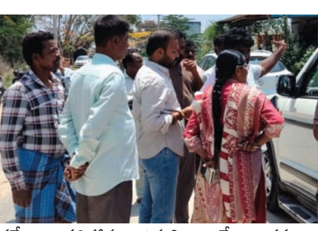
వద్దనే ఆ పరిహారం ఉన్నది. తామే వారసులంటూ పరిహారం కోసం పరుగులు తీస్తున్నారు. మరో వైపు ప్రభుత్వం స్వాధీనం చేసుకున్న భూమి పక్కనే గ్రామ కంట స్థలం కూడా ఉన్నది. దీనిని రైతు తనదేనని