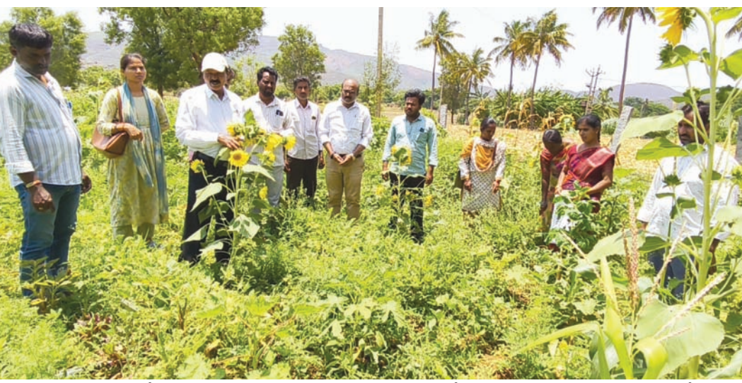
కు 36,500 క్వింటాళ్ళ వేరుశనగ విత్తన కాయలు పంపిణీ లక్ష్యంగా పెట్టుకున్నట్లు తెలిపారు. విత్తన కాయలను జూన్ మొదటి వారంలో పంపిణీ చేసే విధంగా ప్రణాళి