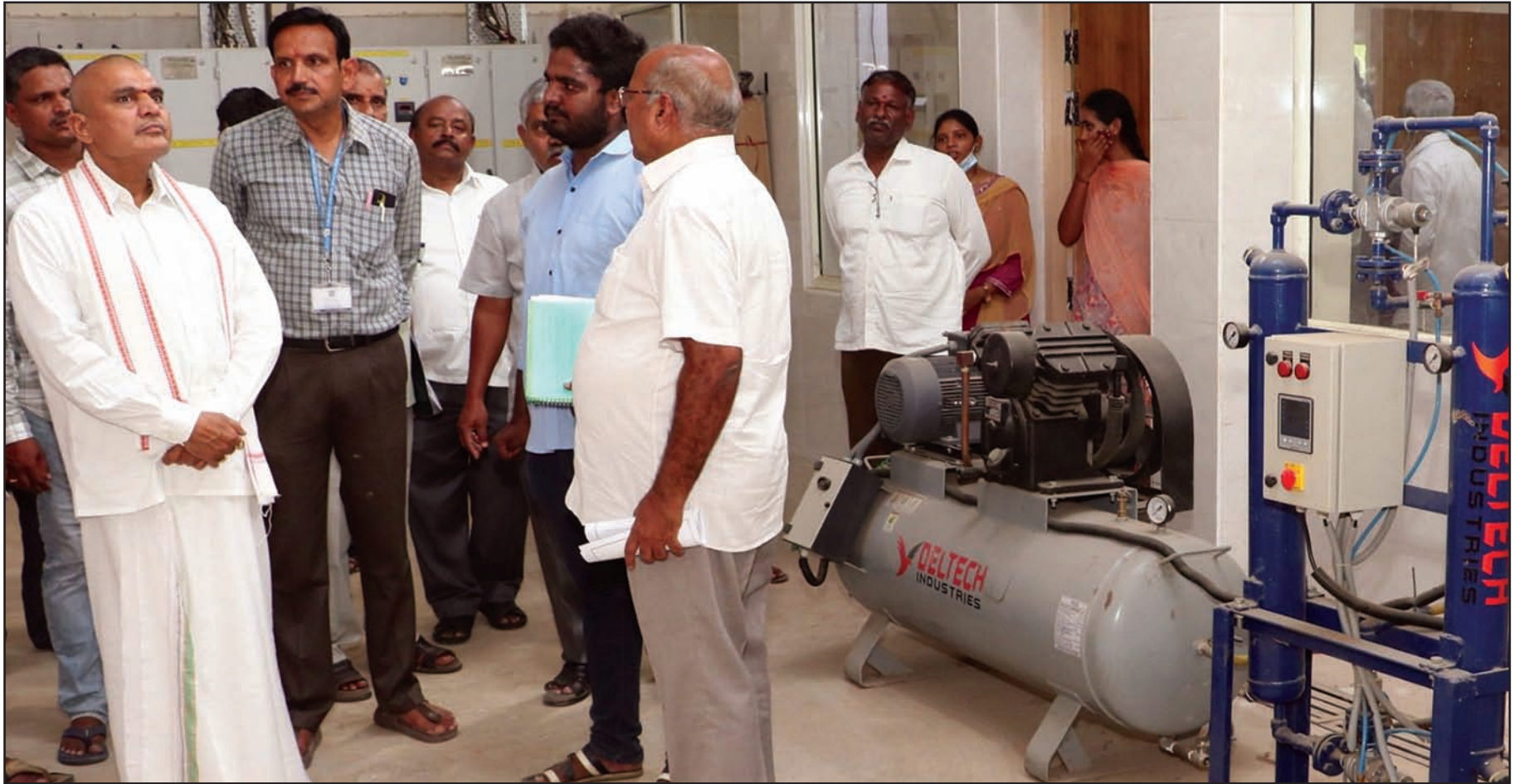
గోశాల నుండి సరఫరా చేసేలా పట్టిష్ట వ్యవస్థను ఏర్పాటు చేస్తున్నట్లు తెలిపారు. ఈ యూనిట్ ద్వారా రోజుకు 2 వేల లీటర్ల పాల