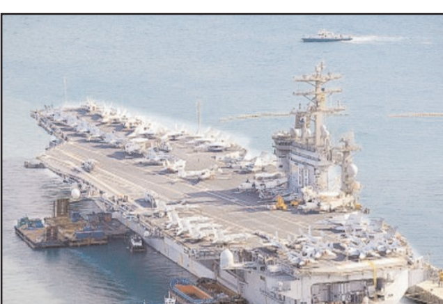
కరేబియన్ సముద్రంలో యుద్ధ నౌక మోహాలంపు..

- రాఫుల్ కాస్ట్రోపై హత్యాభయోగం ఖండించిన క్యూబా - కరేబియన్ తీరంలో యుద్ధ నౌకల మోహాలంపు