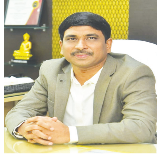
ఎపిఎస్సీడిసిఎల్ ఆధ్వర్యంలో ఈవి చార్జింగ్ స్టేషన్లను

- సమీక్షా సమావేశంలో ఎపిఎస్సీడిసిఎల్ సిఎండ్ సీఎంకర్ లోతేజీ