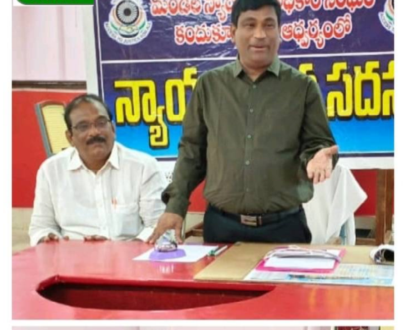
బాల్య వివాహాలు చట్టరీత్యా నేరం