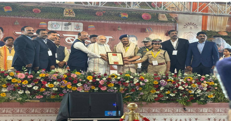
దేశంలోనే ప్రత్యేకతను చాటుకున్న తెలంగాణ పోలీస్ శాఖ. తెలంగాణను నక్కల్ రహిత రాష్ట్రంగా తీర్చిదిద్దిన పోలీసు అధికారులను సన్మానించిన కేంద్ర హోం మంత్రి అమిత్ షా

జగదల్ పూర్ (ఛత్తీస్ గఢ్), మే 18 జై భీష్మ న్యూస్: భారతదేశవ్యాప్తంగా తెలంగాణ పోలీస్ శాఖకు ప్రత్యేకమైన గుర్తింపు ఉందని మరోసారి నిరూపితమైంది. దేశం నుండి వామపక్ష తీవ్రవాదాన్ని పూర్తిగా నిర్మూలించి, నక్కల్ రహిత సమాజాన్ని నిర్మించాలన్న కేంద్ర ప్రభుత్వ సంకల్పాన్ని కేంద్ర హోం మంత్రి అమిత్ షా మరోసారి పునరుద్ఘాటించారు. ఈ లక్ష్య సాధనలో భాగంగా, తీవ్రవాద ప్రభావిత ప్రాంతాల్లో మావోయిస్టు కార్యకలాపాలను అణచివేయడంలో కీలక పాత్ర పోషించిన పోలీసు అధికారులను, సోమవారం ఛత్తీస్ గఢ్ లోని జగదల్ పూర్ లో జరిగిన ఒక ప్రత్యేక కార్యక్రమంలో