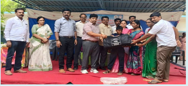
హన్మకొండ, 18 మే 2026 (జై భీష్మ న్యూస్)