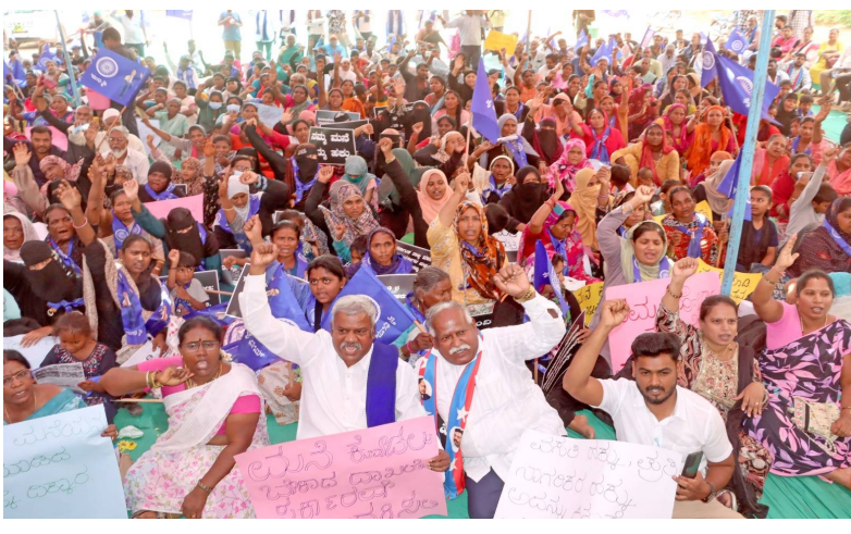
బెంగళూరు, జై భీమ్ న్యూస్ :

"మాకు తలదాచుకోవడానికి చోటు కల్పిస్తే, దీనికి బాధ్యులైన వారందరినీ ధన్యవాదాలు తెలిపి ప్రశాంతంగా బతుకుతాం. లేకపోతే, కనీసం మమ్మల్ని జైల్లో పెట్టండి. అప్పుడు మాకు నివసించడానికి ఒక చోటు, రోజుకు మూడు పూటల భోజనం అయినా లభిస్తుంది." అని ప్రభుత్వం తమ ఇళ్లను కూల్చివేయడంతో నిరాశ్రయులైన కోగిలు లేఅవుట్ మురీకివాడ నివాసితుల ఆవేదన ఇది. డిసెంబర్ 20, 2025న, బెంగళూరు ఉత్తర తాలూకాలోని యలహంక ప్రాంతంలో ఉన్న కోగిలు లేఅవుట్లోని రెండు వందలకు పైగా పేద కుటుంబాల ఇళ్లు అక్రమమైనవని పేర్కొంటూ గ్రేటర్ బెంగళూరు అథారిటీ (జీబీఏ) వాటిని కూల్చివేసింది. ప్రజలు నిద్రలేవక ముందే, తెల్లవారుజామున అధికారులు చేపట్టిన ఈ ఆపరేషన్, షెడ్యూల్డ్ కులాలు, మైనారిటీలు, వెనుకబడిన తరగతులు, అసంఘటిత కార్మికులు, గృహ కార్మికులతో సహా వివిధ వర్గాలకు చెందిన పేద ప్రజలను వీధిపాలు చేసింది. ఇళ్లు కూల్చివేసిన 8 రోజుల తర్వాత పునరావాసం కల్పిస్తామని ప్రభుత్వం హామీ ఇచ్చింది. రాజీవ్ గాంధీ హౌసింగ్ కార్పొరేషన్ అత్యవసరంగా నర్సీను పూర్తి చేసింది. పత్రాల పరిశీలన ప్రక్రియ కూడా పలు దశల్లో జరిగింది. మంత్రులు, ఎమ్మెల్యేలు, ముఖ్యమంత్రి కూడా