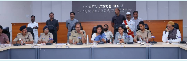
వరంగల్, 18 మే 2026(జై భీమ్ న్యూస్)