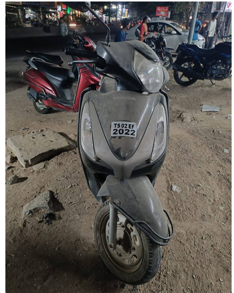
హనుమకొండ జిల్లా/హనువపర్తి, మే 18 (జై భీమ్ న్యూస్)

హనువపర్తి మండలం భీమారం బస్టాండ్ సమీపంలో గుర్తు తెలియని వ్యక్తులు ఓ స్కూటీని పార్క్ చేసి వెళ్లిపోవడంతో స్టానికుల్లో ఆందోళన నెలకొంది. స్టానికుల వివరాల ప్రకారం భీమారం బస్టాండ్ సమీపంలోని సచిన్ సెలార్ ఎదురుగా గ్రే కలర్ కు చెందిన స్కూటీని సుమారు 15 నుంచి 20 రోజుల క్రితం కొందరు నిలిపివెళ్లినట్లు తెలుస్తోంది. అప్పటి నుంచి ఎవరూ వాహనాన్ని తీసుకెళ్లకపోవడంతో అనుమానాలు వ్యక్తమవుతున్నాయి. స్కూటీ రిజిస్ట్రేషన్ నెంబర్ టీఎన్ 03 ఈఎఫ్ 2022గా గుర్తించారు. వాహనం యజమాని ఎవరు..? ఎందుకు అక్కడ వదిలివెళ్లారు..? అనే విషయాలపై స్పష్టత లేకపోవడంతో స్టానికులు పోలీసులకు సమాచారం ఇవ్వాలని కోరుతున్నారు. ఇన్ని రోజులుగా ఒకేచోట వాహనం ఉండటంతో స్టానికులు అప్రమత్తమయ్యారు. ప్రజలు కూడా అనుమానాస్పద పస్తువులు, వాహనాలు కనిపించిన వెంటనే పోలీసులకు సమాచారం అందించాలని స్టానికులు సూచిస్తున్నారు.