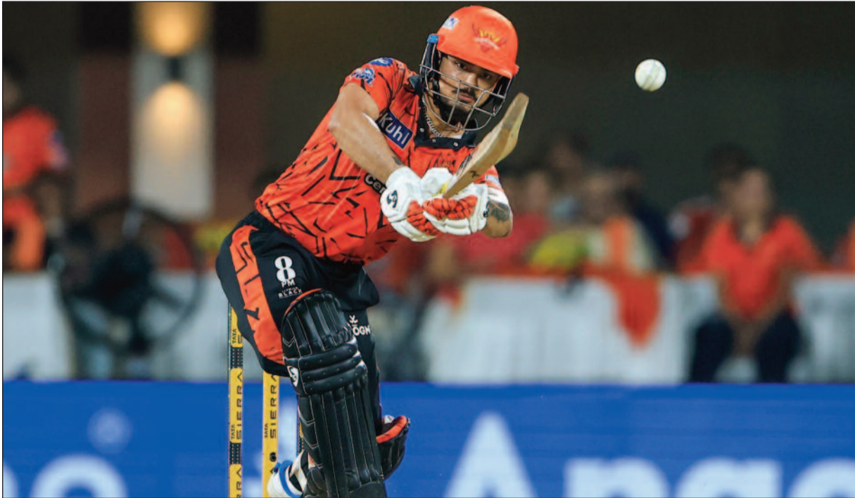
అప్పుడంతో ఐదో వికెట్కు 59 పరుగులు భాగస్వామ్యం ముగిసింది. చివరి రెండు ఓవర్లలో దూబ్, ప్రశాంత్ వీర్ (11)ను కట్టడి చేసిన రైజర్స్ బౌలర్లు చెన్నై భారీ స్కోరును అడ్డుకున్నారు.

చెన్నై: విజిల్ మోత మోగుతూ.. పసుపు సముద్రాన్ని తలపించిన చెపాక్ స్టేడియంలో ఆదిత్య చెన్నై సూపర్ కింగ్స్కు చెక్ పెట్టిన సన్రైజర్స్ హైదరాబాద్ షేఆఫ్స్కు దూసుకెళ్లింది. బంతితో కెప్టెన్ కమిన్స్ (3/28), బ్యాటుతో ఇషాన్ కిషన్ (47 బంతుల్లో 7 ఫోర్లు, 3 సిక్సర్లు 70) చెలరేగడంతో సోమవారం జరిగిన మ్యాచ్లో రైజర్స్ 5 వికెట్ల తేడాతో సీఎస్సీను ఓడించింది. 8 విజయాలు 16 పాయింట్లతో షేఆఫ్స్ బెర్లు సొంతం చేసుకున్న ఆరెంజ్ ఆర్మీ తనతో పాటు గుజరాత్ టైటాన్స్ బెర్లు కూడా ఖాయం చేసింది. ఏడో ఓటమితో చెన్నై దాదాపు ఎలిమినేట్ అయింది.