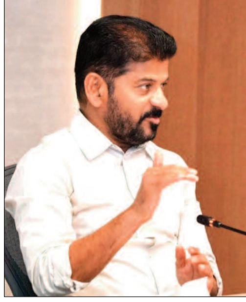
విజయవాడ రోడ్ల సమావేశంలో అందుబాటులో ఉన్న ప్రభుత్వ భూములను వెంటనే గుర్తించాలని ఆదేశించారు. కేవలం హైదరాబాద్లోనే కాకుండా ద్వితీయ శ్రేణి నగరాలలో కూడా ఈ జీసీసీల ఏర్పాటుపై ప్రత్యేకంగా ఫోకస్ పెట్టాలని సరికొత్త ఐటీ అండ్ ఇండస్ట్రీయల్ పాలసీని తీసుకురావాలన్నారు. రాష్ట్రంలో ప్రతిష్టాత్మకంగా రాబోయే బుల్డింగ్ ట్రైన్ ప్రాజెక్ట్ కోసం భూ సేకరణ పనులను తక్షణమే ప్రారంభించాలని సీఎం అధికారులను ఆదేశించారు. వీటితో పాటు రాష్ట్ర ప్రభుత్వ డిజిటల్

విస్తరణ ద్వారా యువతకు స్థానికంగానే ఉపాధి అవకాశాలు కల్పించాలన్నదే తమ లక్ష్యమని పేర్కొన్నారు. అదేవిధంగా డేటాసెంటర్ల ఏర్పాటుకు కంపెనీలకు ఇన్సెంటివ్స్ ఇవ్వాలని సీఎం రేవంత్ రెడ్డి నిర్ణయించారు. హైదరాబాద్ పరిసర ప్రాంతాల్లో కొత్త డేటా సెంటర్ల ఏర్పాటుకు అనువైన ప్రదేశాలను పరిశీలించాలని అధికారులకు ఆదేశాలు జారీ చేశారు. పూర్వరీ సీటీ అభివృద్ధిపై కూడా సీఎం ప్రత్యేకంగా సమీక్ష నిర్వహించారు. పూర్వరీ సీటీలో నెట్-జీరో విధానాలు అమలు చేయాలని, ప్రపంచ స్థాయి విజ సదుపాయాలతో 'విజ సీటీ'ని అభివృద్ధి చేయాలని సూచించారు. ఐటీ , డిజిటల్ ఇన్ఫ్రాస్ట్రక్చర్లో సరికొత్త ఎత్తుకు తీసుకెళ్లేందుకు ముఖ్యమంత్రి రేవంత్ రెడ్డి స్ట్రీడ్ పెంచారు. ఎన్సీఆర్ హెచ్ ఆర్ డి లో జరిగిన పరిశ్రమలు, ఐటీ శాఖల రివ్యూ మీటింగ్లో రాష్ట్రంలో డిజిటల్ నెట్వర్క్ ఐటీ రంగాన్ని ద్వితీయ శ్రేణి నగరాలకు విస్తరించడంపై సీఎం కీలక నిర్ణయాలు తీసుకున్నారు. భవిష్యత్తు అవసరాలను దృష్టిలో ఉంచుకొని రాష్ట్రంలో ఏకంగా 1500 ఎకరాల భారీ విస్తీర్ణంలో ఒక సరికొత్త 'డేటా సీటీ'ని ఏర్పాటు చేయటోపై పట్టు సీఎం ప్రకటించేశారు. ఈ ప్రతిష్టాత్మక డేటా సీటీ నిర్వహణకు భారీగా నీటి అవసరాలు ఉంటాయని, అందుకోసం పూర్వ వాటర్ కాకుండా ఎస్ టీ పీ ల ద్వారా రీ సైకిల్ చేసిన నీటిని వినియోగించేలా ఎ+-లాన్ చేయాలని అధికారులకు సీఎం సూచనలు ఇచ్చారు. అలాగే గ్లోబల్ క్యాపబిలిటీ సెంటర్స్, పెద్ద పెద్ద డేటా సెంటర్ల ఏర్పాటు కోసం కరీంనగర్, వరంగల్,