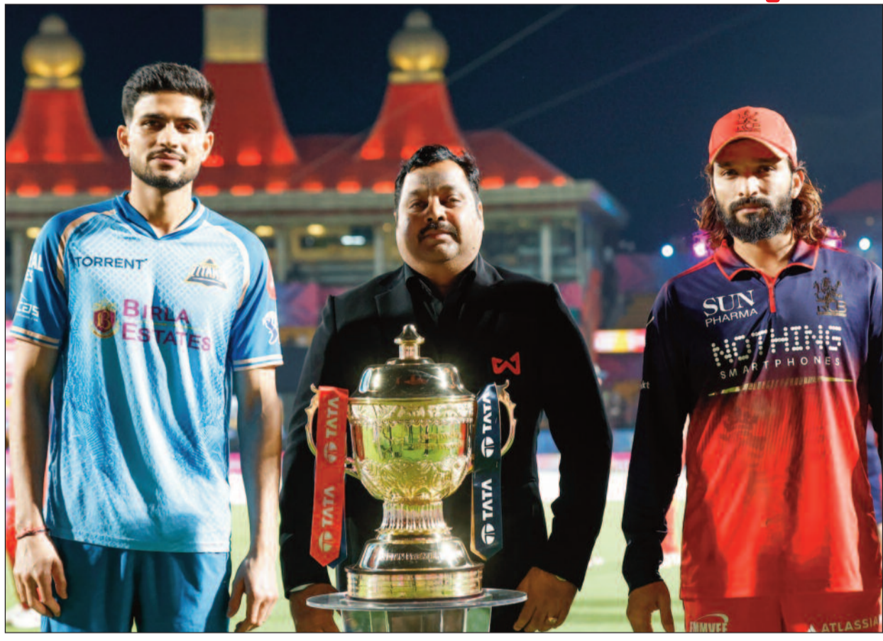
అదృతమైన ఆటతీరును ప్రదర్శించింది. ఆడిన 14 మ్యాచ్ లలో 9 మెరుగైన నెట్ రన్ రేట్ (0.783) కారణంగా పాయింట్ల పట్టికలో విజయాలు, 5 ఓటములతో మొత్తం 18 పాయింట్లు సాధించింది. అగ్రస్థానాన్ని కైవసం చేసుకుని నేరుగా క్వాలిఫయర్-1కు

దూసుకెళ్లింది. యువ కెప్టెన్ రజత్ పాటిదార్ సారథ్యంలో జట్టు ఎంతో సమతుల్యంగా కనిపిస్తోంది. బ్యాటింగ్ విభాగంలో రజత్ పాటిదార్, దేవదత్ పడికల్, విరాట్ కోహ్లా కేటీఎల్ బలకడగా పరుగులు సాధిస్తుండగా, బౌలింగ్ లో సీనియర్ పేసర్ భువనేశ్వర్ కుమార్, జోష్ హేజిల్వుడ్ ప్రత్యర్థి బ్యాటర్లను బెంబేలెత్తిస్తున్నారు. క్వాలిఫయర్-1 లో గుజరాత్ ను ఓడించి నేరుగా ఫైనల్ కు చేరిన ఆర్సీబీ, ప్రస్తుత ఫామ్ ప్రకారం టైటిల్ గెలిచే బలమైన జట్టుగా బరిలోకి దిగుతోంది. మరోవైపు శుభీమన్ గిల్ నేతృత్వంలోని గుజరాత్ బ్లెటాస్ సైతం ఈ సీజన్ లీగ్ దశలో 14 మ్యాచ్ లలో 9 విజయాలు, 5 ఓటములతో 18 పాయింట్లు సాధించి రన్ రేట్ ఆధారంగా రెండో స్థానంలో నిలిచింది. గుజరాత్ జట్టుకు వారి టాప్ ఆర్డర్ బ్యాటింగ్ ప్రధాన బలంగా మారింది. కెప్టెన్ గిల్, సాయి సుదర్శన్, జోన్ బట్లర్ అద్భుతమైన ఫామ్ లో ఉంటూ పరుగుల వరద పాలిస్తున్నారు. బౌలింగ్ విభాగంలో కాగిసో రబాదా, మహ్మద్ సిరాజ్, రషీద్ ఖాన్ వంటి ప్రపంచ స్థాయి బౌలర్లు ఉన్నారు. క్వాలిఫయర్-1 లో ఆర్సీబీ చేతిలో పరాజయం పాలైనప్పటికీ, పట్టుదలకుండా క్వాలిఫయర్-2 లో రాజస్థాన్ రాయల్స్ ను ఓడించి గుజరాత్ ఫైనల్ లో అడుగుపెట్టింది. పాత పగను తీర్చుకుంటూ రెండోసారి ఛాంపియన్ గా నిలవాలని గిల్ సేన గట్టి పట్టుదలతో ఉంది. గణాంకాల ప్రకారం రాయల్ ఛాలెంజర్స్ బెంగళూరుకు స్వల్ప ఆధిక్యం ఉన్నప్పటికీ, ఫైనల్ వంటి భారీ మ్యాచ్ లో ఏ జట్టు ఒత్తిడిని సమర్థవంతంగా ఎదుర్కొంటుందనే దానిపైనే విజయం ఆధారపడి ఉంటుంది. సొంత మైదానంలో ఆడుతుండటం గుజరాత్ కు కలిసివచ్చే అంశమైతే, డిఫెండింగ్ ఛాంపియన్ గా బరిలోకి దిగుతున్న ఆర్సీబీ అత్యుత్సాహం ఆ జట్టుకు కొండంత బలం. ఈ ఆదివారం రాత్రి అమ్మదాబాద్ వేదికగా జరగబోయే ఈ క్రికెట్ సమరంలో విజయం ఎవరిని వరిస్తుందో చూడాలి.