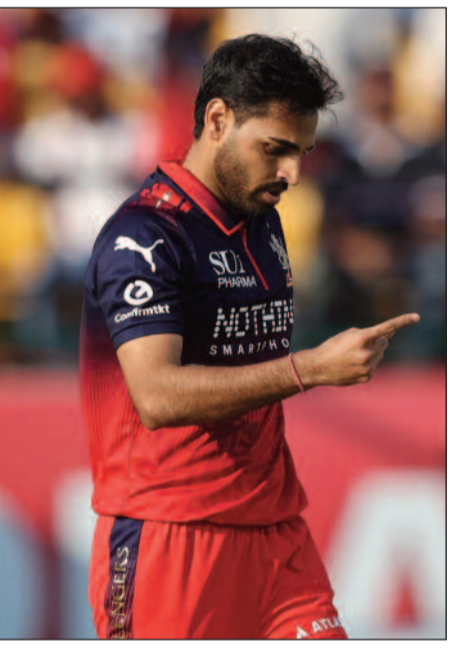
జరగనుంది. టాప్ గెలవాలన్న కెప్టెన్ నిర్ణయం మ్యాచ్ గమనాన్ని మార్చగలదు. అమ్మదాబాద్ పిచ్ ఫాస్ట్ బౌలర్లకు ఎక్కువ సహకారం అందించే అవకాశం ఉంది. ఆదివారం మే 31 నాడు సాయంత్రం 7 గంటలకు టాప్ జరగనుండగా, మ్యాచ్ 7.30 గంటలకు ప్రారంభమవుతుంది. యావత్ భారతదేశం ఈ మ్యాచ్ ను వీక్షించడానికి ఆసక్తిగా ఎదురుచూస్తోంది. గతంలో జరిగిన మ్యాచ్ లో జీటీపై ఆర్సీబీకి ఉన్న రికార్డును పరిగణనలోకి తీసుకుంటే, ఈసారి సిల్వర్ డీమ్ అత్యుత్సాహం రేకెత్తింపు అయ్యింది. జట్టు ఐక్యత, అటగాళ్ల ఫామ్ ఆర్సీబీని ఫేవరేట్ డీమ్ గా

ఐపీఎల్ ఫైనల్ పోరు కోసం బరిలోకి దిగేందుకు రాయల్ ఛాలెంజర్స్ బెంగళూరు సిద్ధంగా ఉంది. ఈ కీలకమైన మ్యాచ్ లో కోహ్లా, పడికల్ ల బ్యాటింగ్ ఎంత ముఖ్యమో, బౌలింగ్ దశలోని ఒక ఆటగాడి బాధ్యత కూడా అంతే పెరిగింది. ఫైనల్ పోరులో గుజరాత్ బ్లెటాస్ ను ఓడించి కప్ గెలవాలనే స్పష్టమైన పూహం ఆర్సీబీకి ఉంది. మ్యాచ్ పై ఉత్సాహం పతాకస్థాయిలో ఉంది, అభిమానులు విజయం కోసం ఆసక్తిగా ఎదురుచూస్తున్నారు. లాస్ట్ టైమ్ గెలవడంతో.. మళ్లీ గెలిచి.. "ఈ సారా కప్ నందే" అనాలని ఫ్యాన్స్ ఎదురుచూస్తున్నారు. క్రికెట్ పండితుల ప్రకారం, ఆర్సీబీ విజయాన్ని ఖాయం చేయడానికి ఫైనల్ లో భువనేశ్వర్ కుమార్ కి కేవలం 3 వికెట్లు మాత్రమే అవసరం. తన స్వింగ్ బౌలింగ్ తో ప్రత్యర్థి బ్యాట్స్ మెన్లను కట్టడి చేయగల భువనేశ్వర్ కుమార్ సామర్థ్యం.. ఆర్సీబీ జిబ్బెనీ కొత్త ఆశలను రేకెత్తించింది. గుజరాత్ జట్టుకి బ్యాటింగ్ అతి పెద్ద షన్ పాయింట్. ఆ బ్యాటింగ్ వెన్నముకును విరిచేందుకు భువనేశ్వర్ కుమార్ వేసే మొదటి కొన్ని ఓవర్లు కీలకం కానున్నాయి. ఆది వర్షపుల్ అయితే.. తిరుగుండడు. ఆర్సీబీ గెలవాలంటే.. జీటీ జట్టులోని కీలక ఆటగాళ్లైన సాయి సుదర్శన్, శుభీమన్ గిల్, జోన్ బట్లర్ వికెట్లు తీసి తీరాలి. ఈ ముగ్గురు అటగాళ్లూ క్రీజులో నిలిస్తే, జీటీ భారీ స్ట్రాక్కు సాధించడం సులభం. అందువల్ల, భువనేశ్వర్ కుమార్ తన తలవైన బౌలింగ్ తో వారిని త్వరగా ఔట్ చేస్తే, జీటీ జట్టు విజయభాగ గోవిందే అవుతుందనడంలో సందేహం లేదు. ఈ ఉత్సాహ భరితమైన ఫైనల్.. గుజరాత్ లోని నరేంద్ర మోదీ స్టేడియంలో