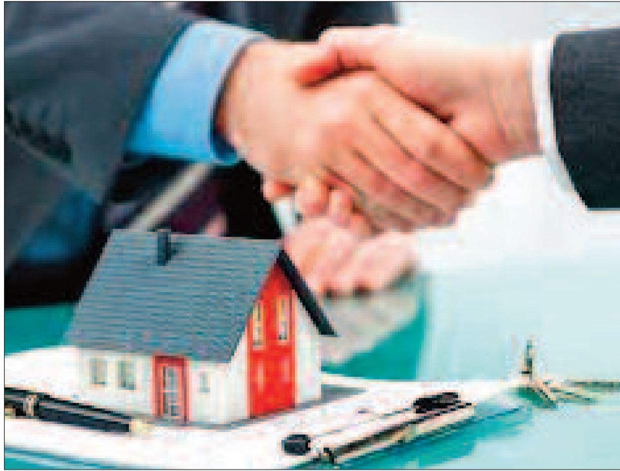
మంచి క్రెడిట్ స్కోరు ఉన్న వ్యక్తుల వివరాలు సేకరించి మా దగ్గర ఉండరగడంతుంటాయి. చూసేందుకు ఈ ఆఫర్లు ఆకర్షణీయంగానే ఉంటాయి. గృహ రుణాలను ఎప్పుడు అర్హతను బట్టిగాక, చెల్లింపు స్టోమతను బట్టి తీసుకోవాలి. నెలవారీ ఖర్చులు, ఇప్పటికే ఉన్న రుణ

ఇటీవల గృహ రుణాల మార్కెట్లోనూ పోటీ పెరిగింది. దీంతో