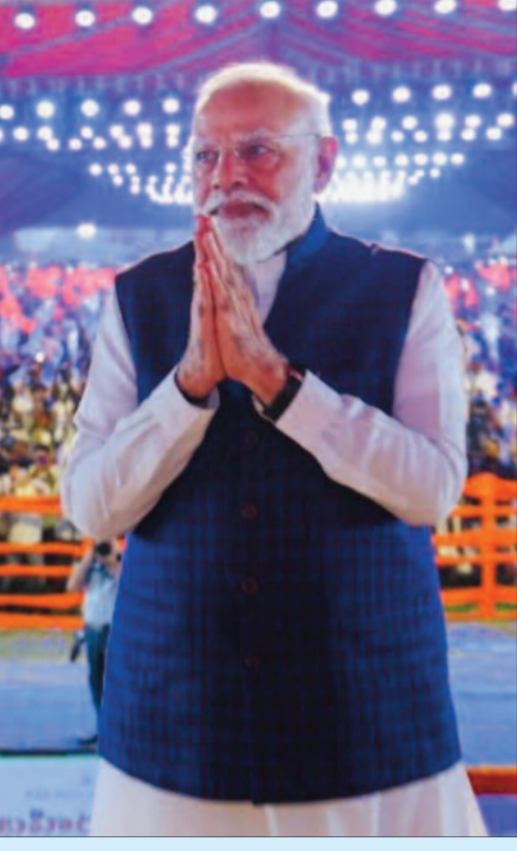
వికసిత భారత్తు మోడీ నవసూత్రాలు

కార్యకర్తలారా.. ఇక లక్ష్యం వైపు దూసుకెళ్లేండి అంటూ తెలంగాణలోని బీజేపీ కేంద్రపు ప్రధాని సరేంద్ర మోడీ పిలుపునిచ్చారు. అవినీతి పార్టీ, కుటుంబ పార్టీలకు ప్రజల్లో ఇక స్థానం లేదని ఆయన స్పష్టం చేశారు. దేశంలో మూడు రాష్ట్రాలకు మాత్రమే పరిమితమైన కాంగ్రెస్ పార్టీ అధినాయకత్వం అనుసరిస్తున్న విధానాలతో క్రమ క్రమంగా పతనమవుతూ వస్తోందని, ఈ పరిస్థితుల్లో దేశంలో ఏకైక ప్రత్యామ్నాయం బీజేపీయేనని ప్రధాని కీలక వ్యాఖ్యలు చేశారు. ఇటు రాష్ట్రంలో బీఆర్ఎస్, కాంగ్రెస్ రెండూ కుటుంబ ప్రయోజనాల కోసం పనిచేసే పార్టీలేనని ప్రధాని సరేంద్ర మోడీ తీవ్రస్థాయిలో విమర్శించారు. కాంగ్రెస్ అధికారంలో ఉన్న రాష్ట్రాల్లో ఒకే రకమైన మోడల్ నడుస్తోందని, ఎన్నికల ముందు అమలు చేయలేని హామీలు ఇచ్చి, అధికారంలోకి వచ్చాక వాటిని తప్పించుకోవడానికి సాకులు వెతకడం ఆ పార్టీకి అలవాటని మండిపడ్డారు. ప్రస్తుతం తెలంగాణలో కూడా కాంగ్రెస్ ప్రభుత్వం ఇదే ధోరణిని అవలంబిస్తోందని ప్రధాని మోడీ ధ్వజమెత్తారు. దేశం మొత్తం మార్పు కోరుకుంటోంది.. ఒకప్పుడు దక్షిణాదిలో, ఈశాన్యంలో బీజేపీని అంటరాని పార్టీగా చూశారని.. ఇప్పుడు వాళ్లే కన్నతల్లిగా కాపాడుకుంటున్నారని ప్రధాని మోడీ అన్నారు. తెలంగాణ యువత ప్రేమ తన కళ్లతో