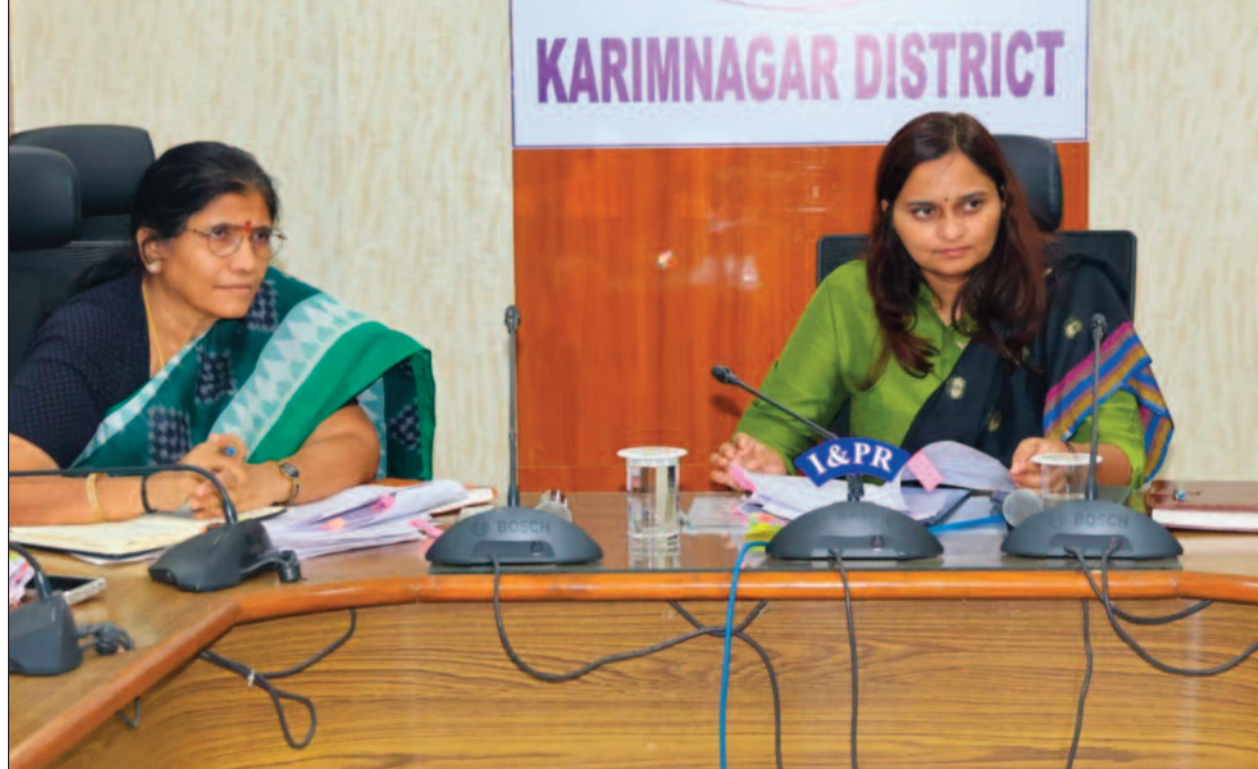
కార్యక్రమాలు చేపట్టాలని, బాల్య వివాహాలు లేని మండలాలుగా ప్రకటించేందుకు కృషి చేయాలని అన్నారు. అన్ని ప్రభుత్వ ప్రైవేటు కార్యాలయాలు పని ప్రదేశాల్లో లైంగిక వేధింపుల నివారణ కమిటీలను బలోపేతం చేయాలని తెలిపారు. సఖి కేంద్రాల్లోని సేవలను మరింత