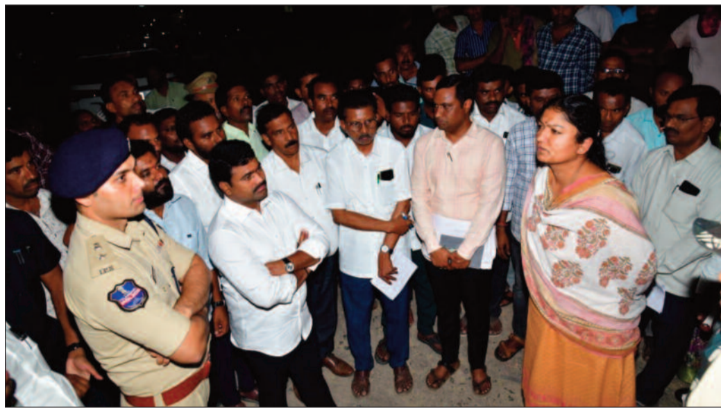
తీసుకోవాలని సూచించారు. అవసరమైనన్ని లారీలను సమకూర్చి ధాన్యాన్ని వెంటనే తరలించాలని, మిల్లుల వద్ద