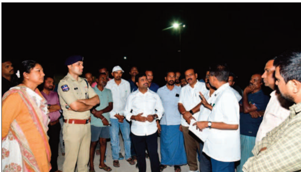
పరస్పర సమన్వయంతో పనిచేసి రైతులకు ఎలాంటి ఇబ్బందులు కలగకుండా చూడాలని కలెక్టర్ స్పష్టం చేశారు. కొనుగోలు, రవాణా ప్రక్రియను వేగవంతం చేయాలని పేర్కొన్నారు. ధాన్యం అన్లోడింగ్ సందర్భంగా మిల్లర్లు ఇబ్బందులు సృష్టిస్తే చర్యలు తప్పవని హెచ్చరించారు. చొప్పదండి ఎమ్మెల్యే మేడిపల్లి సత్యం మాట్లాడుతూ రైతుల ధాన్యాన్ని సకాలంలో కొనుగోలు చేసి త్వరితగతిన మిల్లులకు తరలించాలని కోరారు. రైతులకు

కరీంనగర్, మే 15: గంగాధర మార్కెట్ యార్డు, మధురనగర్లో జరుగుతున్న ధాన్యం కొనుగోలు ప్రక్రియను గురువారం రాత్రి జిల్లా కలెక్టర్ చిత్రా మిశ్రా, చొప్పదండి ఎమ్మెల్యే మేడిపల్లి సత్యం, పోలీస్ కమిషనర్ గాష్ ఆలం కలిసి పరిశీలించారు. ఈ సందర్భంగా రైతులతో మాట్లాడిన అధికారులు కొనుగోళ్ల పరిస్థితిపై వివరాలు తెలుసుకున్నారు. జిల్లా కలెక్టర్ చిత్రా మిశ్రా మాట్లాడుతూ ధాన్యం కొనుగోళ్లు డెడ్లైన్ ప్రకారం ముమ్మరంగా చేపట్టాలని అధికారులను ఆదేశించారు. కొనుగోలు చేసిన ధాన్యాన్ని మూడు రోజుల్లోగా మిల్లులకు తరలింపేలా చర్యలు తీసుకోవాలని సూచించారు. ధాన్యం నిల్వలు పేరుకుపోకుండా పెద్ద ఎత్తున లారీలను సమకూర్చి వెంట వెంటనే రవాణా చేపట్టాలని తెలిపారు. మిల్లుల వద్ద కూడా వేగంగా అన్లోడింగ్ జరిగేలా సమన్వయం చేసుకోవాలని సూచించారు. అధికారులు