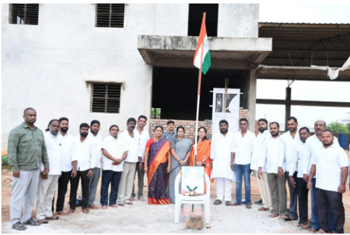
త్యాగాలను స్మరించుకుంటూ, వారి సేవలను ఎప్పటికీ మరువలేమని పేర్కొన్నారు. అలాగే ముఖ్యమంత్రి ఎ. రేవంత్ రెడ్డి నాయకత్వంలోని