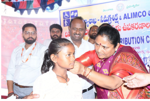
జగ్గారెడ్డి సూచించారు. ప్రభుత్వం దివ్యాంగుల సంక్షేమం కోసం అనేక కార్యక్రమాలు చేపడుతోంది, వాటిని సద్వినియోగం చేసుకోవాలని తెలిపారు. తల్లిదండ్రులు కూడా పిల్లలకు ప్రోత్సాహం అందించి వారి భవిష్యత్తును ఉన్నతంగా తీర్చిదిద్దాలని కోరారు.

అత్యున్నత స్థాయిలో పట్టుదలతో చదివి ఉన్నత స్థాయికి ఎదిగిన ఎంతో మంది దివ్యాంగులు ప్రపంచానికి ఆదర్శంగా నిలిచారు. ఎంతో మంది దివ్యాంగులు ప్రపంచానికి ఆదర్శంగా నిలిచారు. ఎంతో మంది దివ్యాంగులు ప్రపంచానికి ఆదర్శంగా నిలిచారు. ఎంతో మంది దివ్యాంగులు ప్రపంచానికి ఆదర్శంగా నిలిచారు.