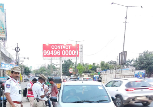
ప్రాణాపాయం ఏర్పడే అవకాశం ఉందని హెచ్చరించారు. వ్యతిరేక దిశలో ప్రయాణిస్తూ ప్రమాదానికి గురైతే వాహన

మల్కాజిగిరి కమిషనరేట్ పరిధిలో వ్యతిరేక దిశలో వాహనాలు నడిపే డ్రైవర్లపై కఠిన చర్యలు తీసుకోవాలన్న ఉన్నతాధికారుల ఆదేశాల మేరకు జవహర్నగర్ ట్రాఫిక్ పోలీసులు సోమవారం ప్రత్యేక డ్రైవ్ నిర్వహించారు. జవహర్నగర్ ట్రాఫిక్ పోలీస్ స్టేషన్ పరిధిలోని నాగారం, బాలాజీ నగర్ ప్రాంతాల్లో చేపట్టిన ఈ తనిఖీల్లో రాంగ్ రూట్లో ప్రయాణిస్తున్న వాహనదారులపై భారీగా చలాన్లు విధించారు. ఈ ఒక్కరోజే 400కు పైగా వాహనదారులపై చలాన్లు సమూహం చేసినట్లు పోలీసులు తెలిపారు. టైలర్తో పాటు ఆటోలు, కార్లు కూడా వ్యతిరేక దిశలో నడవడం గమనార్హమని పేర్కొన్నారు. రాంగ్ రూట్లో వాహనం నడవడం వల్ల వాహనదారుడికి కాకుండా సరైన దిశలో వచ్చే ఇతరులకు కూడా