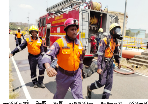
కావడంతో ఫ్లాష్ ఫైర్ జరిగినట్లు ఊహించి ప్రమాద నివారణ చర్యలను ప్రదర్శించారు. ప్రమాదాన్ని గుర్తించిన సెక్యూరిటీ సిబ్బంది వెంటనే కంట్రోల్ రూమ్కు సమాచారం అందించగా, అనంతరం ఎన్టీఆర్ఎఫ్, ఆర్డీఎఫ్, మెడికల్, ఫైర్, పోలీస్, ట్రాఫిక్, పాల్యూషన్ కంట్రోల్ బోర్డ్ తదితర శాఖల బృందాలు సంఘటనా

మేధుల్ మల్కాజిగిరి జిల్లా ఘట్టేసర్లోని హిందుస్థాన్ పెట్రోల్ కాంప్లెక్స్ లిమిటెడ్ (హెచ్పీసీఎల్)లో సోమవారం పరిశ్రమల అగ్ని ప్రమాదాల నివారణపై మార్కెట్ నిర్వహించారు. జాతీయ వివత్తు నిర్వహణ ప్రాధికార సంస్థ మార్గనిర్దేశకత్వంలో, తెలంగాణ రాష్ట్ర ప్రభుత్వ ఆధ్వర్యంలో ఈ కార్యక్రమం చేపట్టారు. హెచ్పీసీఎల్లో ఒక ట్యాంక్ నుంచి మరొక ట్యాంక్కు ఆయిల్ మార్పిడి చేస్తున్న సమయంలో ఆయిల్ ఓవర్ఫ్లో