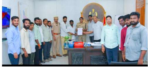
కోరుతున్నాము.ప్రధాన డిమాండ్లు.1. రాష్ట్రంలో చట్టవిరుద్ధంగా కొనసాగుతున్న గోవధ శాలలను తక్షణం మూసివేయాలి.2. ఆక్రమణలో ఉన్న గోవధ భూములను విముక్తి చేయాలి.3. ప్రస్తుతం గుర్తింపు పొందిన గోశాలలకు నిధులు కేటాయించాలి.4. ప్రతి జిల్లాలో రాష్ట్ర ప్రభుత్వం ఆధ్వర్యంలో గోశాలలను ఏర్పాటు చేయాలి.5. దేవదాయ శాఖ పరిధిలోని అన్ని దేవాలయాలలో గోవులను పెంచాలి.6. గో ఆధారిత వ్యవసాయం చేస్తున్న రైతులకు మరియూ గోపాపాలకు తగిన ప్రోత్సాహాలను అందించాలి.7. బక్రీద్ సందర్భంగా గోరక్షకులు ఆవులు పట్టుకొని పోలీసులకు తెలియజేసి విధంగా గోరక్షకులకు గుర్తింపుపత్రాలు తెలంగాణ రాష్ట్ర ప్రభుత్వం ఇవ్వాలి.8. భాగ్యనగర్ బోరబండలోని బిల్డింగు, నార్సింగ్ మొదలైన స్థలాల్లో నిర్వహిస్తున్న పశువుల సంరక్షణ తక్షణమే .9. వెంటనే భాగ్యనగర్ తో పాటు రాష్ట్రంలో ఉన్న అన్ని ప్రధాన నగరాలు, పట్టణాల శివారులలో ప్రత్యేకంగా పోలీస్ చెక్ పోస్టులను ఏర్పాటు చేసి అక్రమంగా తరలింపబడుతున్న గో సంతతిని రక్షించటమే గాకుండా రవాణా క్రాకకు ఉపయోగిస్తున్న ట్రక్కులను సీజ్ చేసి యజమానులపై కఠిన చర్యలు తీసుకోవాలి.10. రక్షింపబడని గో సంతతి పోషణ కొరకు ప్రభుత్వమే పశుశాలలను (క్యాట్ల పార్క్) ఏర్పాటు

బక్రీద్ సందర్భంగా పకడ్బందీగా గోరక్ష చట్టాలు కఠినంగా అమలు చేయాలని ఎస్.పి విసిక్ కి వినతిపత్రం విశ్వహిందూ పరిషత్, బజరంగ్ దళ్ సకల దేవతా స్వరూపం గోమాత. వేదకాలం నుండి గోవును ఆరాధ్య దేవతగా పూజిస్తున్నాము. దేశ ఆర్థిక వ్యవస్థ పరిపూర్ణత మొదలుకుని పర్యావరణ పరిరక్షణ... వ్యవసాయంతో పాటు మానవాళి ఆరోగ్య రక్షణకు గోమాత ఆధారం. అలాంటి గోవులను ప్రస్తుతం విచ్చలవిడిగా వధించి మాంసాహారంగా ఉపయోగించుకుంటున్నారు. వేలాది టన్నుల గోమాంసాన్ని విదేశాలకు ఎగుమతి చేస్తున్నారు. గోవును కాపాడుకోవాలనే ఉద్దేశంతో ఉమ్మడి ఆంధ్రప్రదేశ్ ప్రభుత్వం 1977 సంవత్సరంలో తెలంగాణ ప్రోహిబిషన్ ఆఫ్ కౌ సైలర్ అండ్ అనిమల్ ప్రెజర్వేషన్ యాక్ట్ 1977 ను అమలులోకి తెచ్చింది. ప్రస్తుతం ఈ చట్టం తెలంగాణలో అమలులో ఉంది. రాజ్యాంగంలోని ఆదేశిక సూత్రాలు, ఆర్టికల్ 48 నిబంధనల కూడా గోరక్ష కోసం ఏర్పాటు చేసినవే. అయినప్పటికీ చట్టవిరుద్ధంగా రాష్ట్రంలో విచ్చలవిడిగా గోవధ జరుగుతోంది. బిల్డింగా ఉన్న ఎద్దులనుకూడా వధిస్తున్నారు.ముఖ్యంగా బక్రీద్ సందర్భంగా ఈ గోవధ మరి రద్దీంపు స్థాయిలో జరుగుతోంది. చట్టాన్ని అమలు చేయవలసిన ప్రభుత్వ యంత్రాంగం చేట్టబడిగా చూసి చూడనట్లుగా వ్యవహరిస్తున్నారు. గో శ్రమికులు, గోరక్ష సంస్థలు అనేక సార్లు విజ్ఞప్తి చేసినా పాలకులు పట్టించుకోవడం లేదు. కనుక ఇప్పటికైనా గోపాత్య నిషేధ చట్టాన్ని కఠినంగా అమలు చేసి విధంగా తగు చర్యలు తీసుకోవాలని మిమ్మల్ని