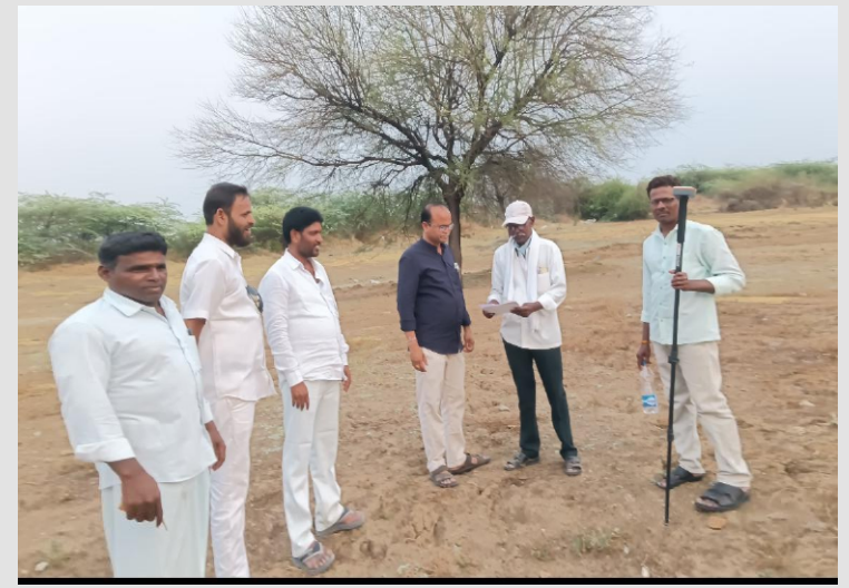
మన మహతి. న్యూస్ ప్రతినిధి నారాయణపేట జిల్లా మక్తల్ నియోజకవర్గం.