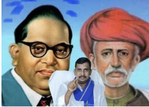
తెలుగుదేశం పార్టీ నాయకులు!