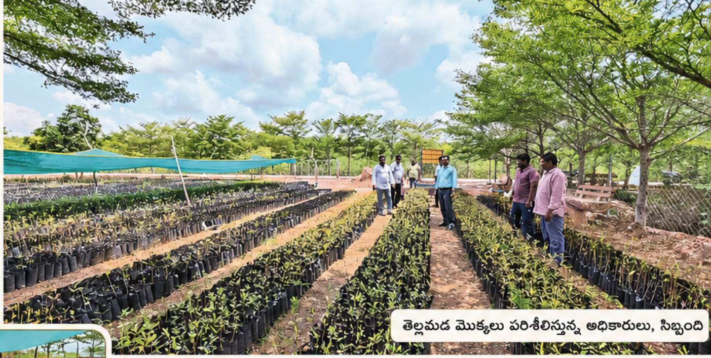
తెల్లమడ మొక్కలు పరిశీలిస్తున్న అధికారులు, సిబ్బంది

యానాంలో మడ మొక్కల పెంపకం యానాంలోని డరియాలతిప్ప మూడో సంబరు దీవిలో అటవీ, వన్యమృగ సంరక్షణశాఖ చేపట్టిన మడ మొక్కల పెంపకం సర్వరీ సత్పితాలస్తోంది.