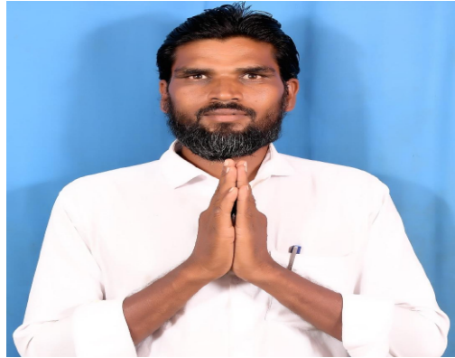
స్టేజ్ పై ఎలా మాట్లాడాలి నేర్పించడం స్వచ్ఛమైన రైటింగ్ నేర్పించడం