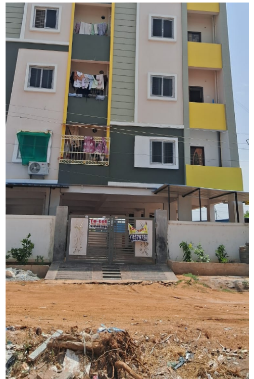
రోడ్డుపైకి వస్తున్నా అధికారులు మాత్రం నిమ్మకు నీరెత్తినట్లు వ్యవహరిస్తున్నారని, వారి చోర్యం వెనుక అసలు రహస్యం

●అనుమతులపై మున్సిపల్ అధికారుల నిర్లక్ష్యం? ●పట్టించుకోని వైసెం.. స్థానికుల ఆగ్రహం