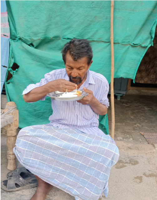
రాజ్యాంగం ప్రతి మనిషికి గౌరవప్రదమైన జీవితం హక్కుగా ఇచ్చింది. "ఎవరూ ఆకలితో చావకూడదు" అనే భావన ఒక ప్రభుత్వ బాధ్యత మాత్రమే కాదు --- అది మానవత్వానికి సంబంధించిన విలువ. చిన్నపిల్లల ఆరోగ్యం ఎంత ముఖ్యమో, వృద్ధుల గౌరవప్రదమైన జీవితం కూడా అంతే ముఖ్యమైనది. ఈ నేపథ్యంలో ప్రభుత్వం ఒక మానవతా దృక్పథంతో

●వ్యాసకర్త: బస్మీ నాయక్ మన సమాజంలో చిన్నపిల్లల ఆరోగ్యం, పౌష్టికాహారం కోసం ప్రభుత్వం అంగన్వాడీ కేంద్రాల ద్వారా అనేక సేవలు అందిస్తోంది. గర్భిణీలు, బాలింతలు, చిన్నారులకు పౌష్టికాహారం, విద్య, ఆరోగ్య పరిరక్షణ అందించడం నిజంగా అభినందనీయం. ఎందుకంటే ఒక చిన్నారి ఆరోగ్యంగా పెరిగితేనే దేశ భవిష్యత్తు బలపడుతుంది. అయితే ఇదే సమయంలో మన కళ్లముందు మరో బాధాకరమైన వాస్తవం కూడా కనిపిస్తోంది. ఎన్నో పేద కుటుంబాల్లో ఉదయం పని కోసం వెళ్లే వారు ఇంట్లో కూర వండుకునే పరిస్థితి లేక వట్టి అన్నం కట్టుకొని పనికి వెళ్తున్నారు. కొందరు నూనె కారం, ఉప్పు, నీరు లేదా పెరుగుతో ఒక పూట గడిపేస్తున్నారు. ఇంట్లో వృద్ధులు ఉంటే వారి పరిస్థితి మరింత దయనీయంగా మారుతోంది. కూరలు లేకపోతే నీళ్లు పోసుకొని అన్నం తినడం, పాత కారం వేసుకొని ఆకలి మంట ఆర్చుకోవడం వంటి దుస్థితులు ఇంకా గ్రామాల్లో, పట్టణాల పేద బస్టిల్లో కనిపిస్తున్నాయి. వృద్ధాప్యం అనేది మనిషి జీవితంలో అత్యంత బలహీనమైన దశ. ఈ దశలో శరీరానికి పోషకాహారం అత్యంత అవసరం. కానీ ఎంతోమంది వృద్ధులకు సరైన ఆహారం దొరకడం లేదు. చేతులు పనిచేయపు, సంపాదించే శక్తి ఉండదు, కుటుంబ సభ్యులపై ఆధారపడతూ వస్తుంది. కొందరికి పిల్లలు ఉన్నా వట్టింతుకారు. మరికొందరికి ఎవరూ ఉండరు. చివరికి ఆకలితో, అనారోగ్యంతో, అవస్థలతో జీవితం ముగుస్తోంది.