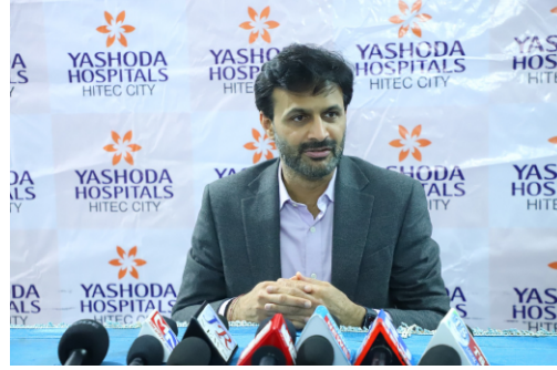
లివర్ ఆరోగ్యాన్ని కాపాడుకోవాలంటే క్రమం తప్పకుండా రక్తపరీక్షలు, అల్ట్రాసౌండ్ స్కానింగ్ చేయించుకోవాలని సూచించారు. హెపటైటిస్ బి, సి వైరస్లు చాలామందికి తెలియకుండానే శరీరంలో ఉండి క్రమేపీ లివర్ను దెబ్బతీస్తాయని తెలిపారు. ముందుగానే పరీక్షల ద్వారా గుర్తిస్తే వ్యాక్సినేషన్, చికిత్సలతో ప్రమాదాన్ని తగ్గించవచ్చన్నారు.

●స్వాతి లివర్, హెపటైటిస్ తో క్యాన్సర్ ప్రమాదం పెరుగుతోంది ●ముందస్తు పరీక్షలతో ప్రాణాలు కాపాడుకోవచ్చు.