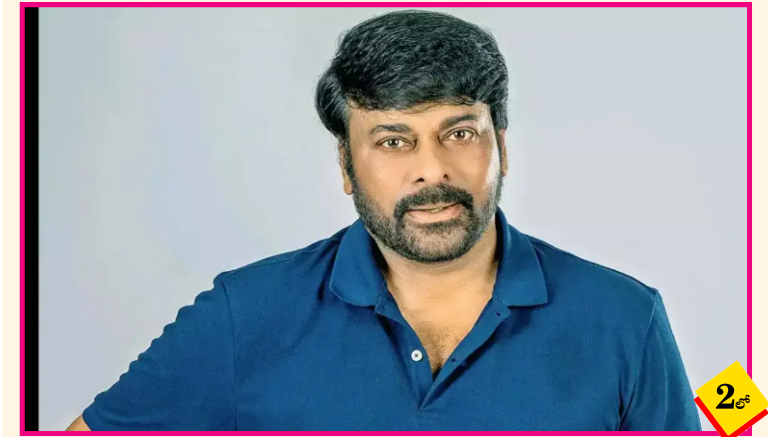
ఎన్టీఆర్ కు భారతరత్న పురస్కారం ఇవ్వాలి యువతను రాజకీయాల్లో ప్రోత్సహించిన మహోన్నతుడు మహానాడు తీర్మానంలో చంద్రబాబు డిమాండ్

మాజీ సీఎం, తెలుగుదేశం పార్టీ వ్యవస్థాపకుడు నందమూరి తారక రామారావు తెలుగుజాతి సెంటిమెంట్ అని ఆంధ్రప్రదేశ్ ముఖ్యమంత్రి నారా చంద్రబాబు నాయుడు వ్యాఖ్యానించారు. ఎన్టీఆర్ కు భారతరత్న ఇవ్వాలని కేంద్రప్రభుత్వాన్ని ఆడుగుతానని పేర్కొన్నారు. గురువారం రెండోరోజు మంగళగిరిలో జరుగుతున్న మహానాడు వేడుకలో ఎన్టీఆర్ విగ్రహానికి పూలమాల వేసి సీఎం చంద్రబాబు, మంత్రి లోకేశ్, డిడిపీ సీనియర్ నేతలు, మంత్రులు నివాళులు అర్పించారు. 1,875 క్షుద్ధ సుంచి మహానాడుకు డిడిపీ నేతలు, శ్రేణులు భారీగా హాజరయ్యారు. ఎన్టీఆర్ జయంతిని పురస్కరించుకుని మహానాడులో ఆయనకు నివాళి అర్పించే తీర్మానంపై సీఎం ప్రసంగించారు. ఎన్టీఆర్ కు భారతరత్న ఇవ్వాలని మహానాడులో ప్రతిపాదించారు. దేశ అత్యున్నత పౌర పురస్కారం ఎన్టీఆర్ ను సత్కరించాలని సీఎం చంద్రబాబు కోరారు. ని చెప్పుకోవచ్చు. ఎన్టీఆర్ పాలన రైతులకు అండ, మహిళలకు భరోసా, కార్మికులకు ఆధారం.. యువతకు దిక్పావి అని సీఎం చంద్రబాబు వ్యాఖ్యానించారు. 1983లో రాజకీయాల్లో యువతకు ఎన్టీఆర్ అవకాశాలు కల్పించారని ప్రస్తావించారు. పేజీ 2లో