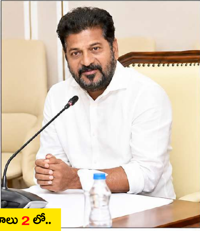
వివరాలు 2 లో..