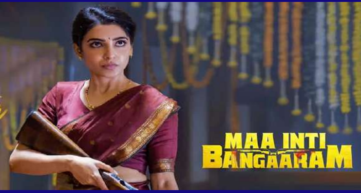
MAA INTI BANGARAM

ప్రముఖ నటి సమంత సినిమా 'మా ఇంటి బంగారం' విడుదల వాయిదా పడింది. ఈ నెల 15న రిలీజ్ చేయాలనుకున్న ఈ చిత్రాన్ని.. జూన్ 19న ప్రేక్షకుల ముందుకు తీసుకురానున్నట్లు మేకర్స్ ప్రకటించారు. ఐపీఎల్ కీలక దశకు చేరుకుంటున్న నేపథ్యంలో పోస్టపోస్ట్ చేశారు. 'ఓ బేబీ' తర్వాత సమంత ప్రధాన పాత్రలో దర్శకురాలు నందినిరెడ్డి తెరకెక్కించిన చిత్రమిది. బాలీవుడ్ నటుడు గుల్షన్ దేవయ్య మరో కీలక పాత్రధారి. క్రైమ్ థ్రిల్లర్ కథతో రూపొందిన ఈ చిత్రంలో సమంత.. మునుపెన్నడూ చూడని లుక్లో కనిపించనున్నారు. ఈ సినిమాలో ఆమె ఫైట్స్ కూడా చేయడం విశేషం. తన నిర్మాణ సంస్థ ట్రాలాలా మూవింగ్ పిక్చర్స్ పతాకంపై సమంత నిర్మించిన రెండో సినిమా ఇది. ఆమె భర్త, దర్శకుడు రాజ్ నిడిమెరు, హిమాంక్ దువ్వూరి సహ నిర్మాతలు.