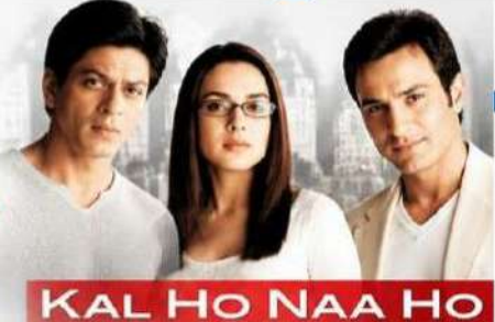
KAL HO NAA HO

హంట్ ప్రేక్షకుల్ని విశేషంగా ఆకట్టుకున్న చిత్రాల్లో 'కల్ హో నా హో' ముందు వరుసలో ఉంటుంది. బాలీవుడ్ అగ్రహీరో షారుక్ ఖాన్, సైక్ అలిఖాన్, ప్రీతి జింతా తదితరులు కీలక పాత్రలు పోషించారు. ఈ రోమాంటిక్ డ్రామాలో నైనా పాత్రలో కనిపించి కుర్తూరూని అలరించింది ప్రీతి.