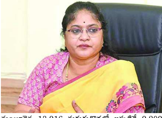
మంజూరైన 13,916 మరుగుదొడ్లలో ఇప్పటికే 9,209 నిర్మాణాలు పూర్తయ్యాయని చెప్పారు. 15,521 తాగునీటి కనెక్షన్లలో 12,131 కేంద్రాల్లో పనులు పూర్తయ్యాయని వెల్లడించారు.