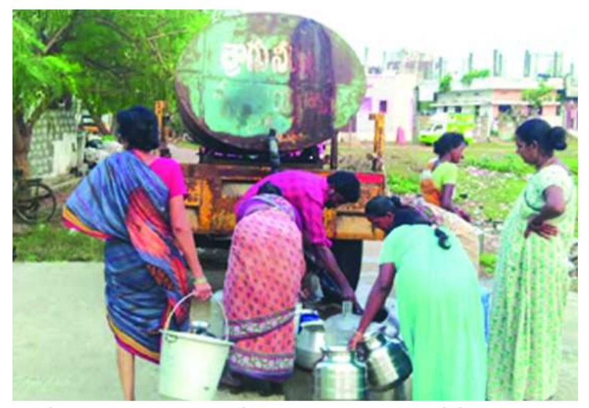
తాగునీటి సరఫరా వంటి చర్యలు చేపట్టినట్లు వివరించారు. ప్రజల్లో నీటి వినియోగంపై అవగాహన కార్యక్రమాలు కూడా నిర్వహిస్తున్నట్లు వివరించారు.

అమరావతి, పతాకం న్యూస్: పట్టణ ప్రాంతాల్లో మంచినీటి సరఫరాకు చర్యలు తీసుకుంటున్నామని, ప్రస్తుతం 38 పట్టణ ప్రాంతాల్లో రెండు రోజులకోసారి నీటి సరఫరా చేస్తున్నామని, ఏడు చోట్ల మూడు రోజులకోసారి సరఫరా చేస్తున్నామని పట్టణాభివృద్ధి శాఖ డైరెక్టర్ సంవత్సకం తెలిపారు.