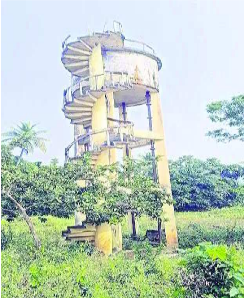
అనకాపల్లిపశాకం న్యూస్: జిల్లాలోని గ్రామీణ ప్రాంతాల్లో తాగునీటి కష్టాలు మొదలయ్యాయి. గ్రామ పంచాయతీల్లో పాలకవర్షాల పడవీకాలం ముగియడం, సాధారణ నిధుల కొరత వంటి కారణాలతో గ్రామీణ రక్షిత నీటి సరఫరా (ఆర్డబ్ల్యూఎస్) పథకాల నిర్వహణ ప్రశ్నార్థకంగా మారింది. పథకాల నిర్వహణకు ప్రభుత్వం నుంచి నిధులు విడుదల కాకపోవడంతో గ్రామ పంచాయతీలు తీవ్ర ఆర్థిక ఇబ్బందులు ఎదుర్కొంటున్నాయి. దీంతో మోటార్ల మరమ్మతులు, పైపులైన్ లీకేజీల నివారణ, విద్యుత్

నిధులేక సక్రమంగా జరగని రక్షిత నీటి సరఫరా.. మోటార్లు మరమ్మతులకు గురికావడంతో ఇబ్బందులు